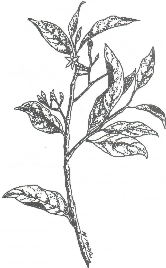
Fig.7. Brosimum alicastrum Sw.

galactógenas. Las hojas son muy solicitadas para hacer cocimiento con ellas y tomarlo, a fin de hacer aumentar la secreción de la leche en las mujeres que están criando. Ref.: Díaz, 1922; Roig, 1965; Roig, 1974.