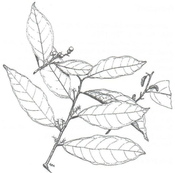
Fig.8. Trophis racemosa (L.) Urb.