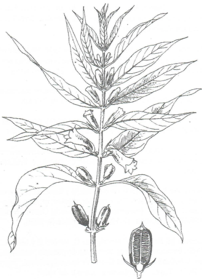
Fig. 9. Sesamum occidentale L.