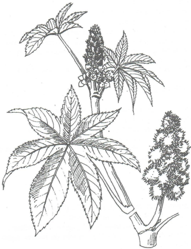
Fig.5. Ricinus communis L.