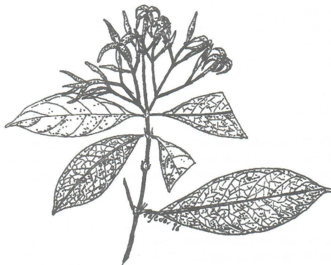
Fig.10. Faramaea occidentalis (L.) A. Rich.