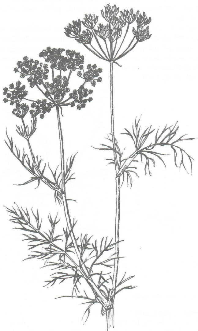
Fig. 1. Anethum graveolens L.