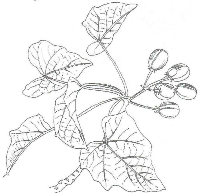
Fig. 4. Jatropha curcas L.