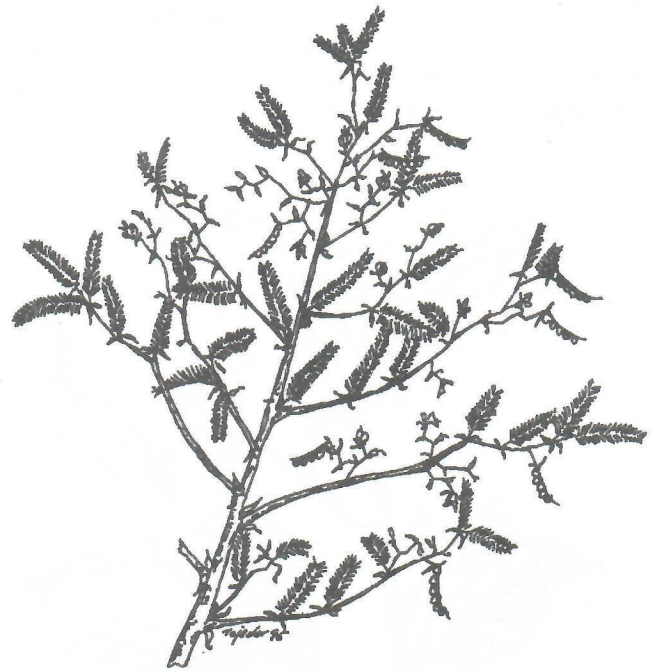
Fig.6. Aeschynomene americana L.

Notas: Roig (1974), citando una referencia de Gómez de