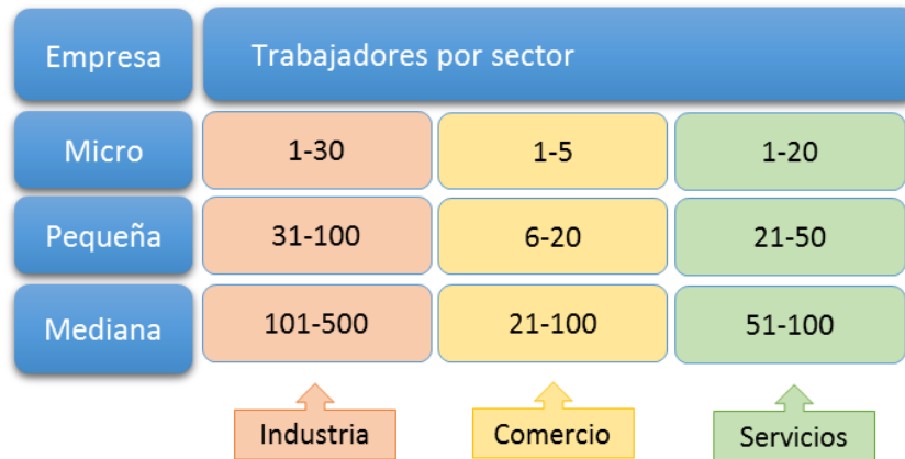
Figura 1. Clasificación de empresas según Nacional Financiera, México.

Colombia, bajo la Ley 590 (Departamento de la Función Pública, 2000) y la Ley 905 (Departamento de la Función Pública, 2004) para el fomento de la micro, pequeña y mediana empresa, define las pymes como «toda unidad de explotación económica, realizada por personas naturales o jurídicas, en actividades