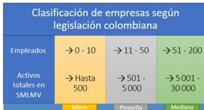
Figura 2. Clasificación de empresas según legislación colombiana.

empresariales [...] que responda a dos de los siguientes parámetros: número de trabajadores de la planta de personal y el valor total de los activos expresado en salarios mínimos legales mensuales vigentes (SMLMV)» (p. 1), según se resume en la Figura 2.