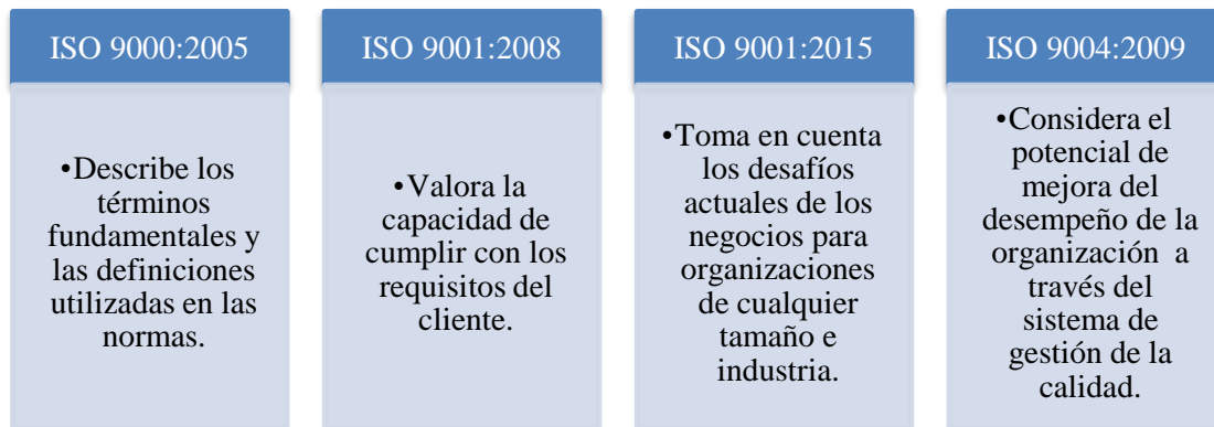
Figura 5. Familia de normas ISO 9000.