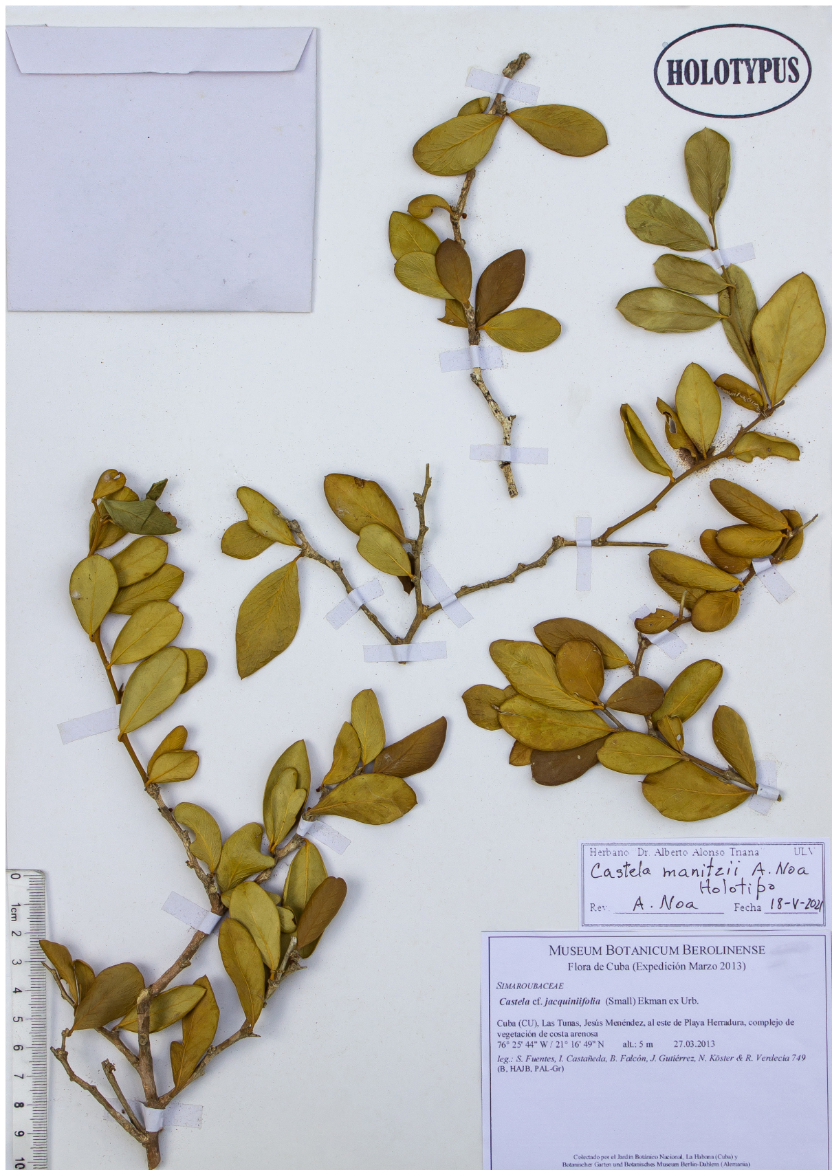
Fig. 9. Holotipo de Castela manitzii , depositado en el Herbario del Jardín Botánico de Villa Clara (ULV).