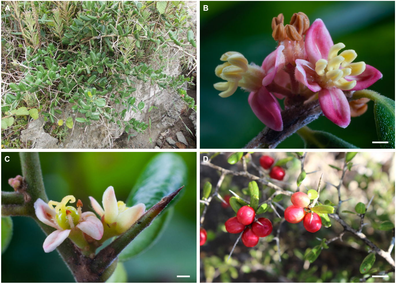
Fig. 8. Castela calcicola . A. Hábito. B. Flor ♂. C. Flor ♀. D. Rama con frutos maduros. Planta en el matorral xeromorfo costero de Playa Jibacoa, provincia Mayabeque (A), y cultivada en el Jardín Botánico de Villa Clara (B-D). Barras de escala: 2 mm (B-C) y 1 cm (D).

Fig. 8. Castela calcicola . A. Habit. B. Flower ♂. C. Flower ♀. D. Branch with ripe fruits. Plant in the coastal xeromorphic scrub of Playa Jibacoa, Mayabeque province (A), and cultivated in the Botanical Garden of Villa Clara (B-D). Scale bars: 2 mm (B-C) and 1 cm (D).