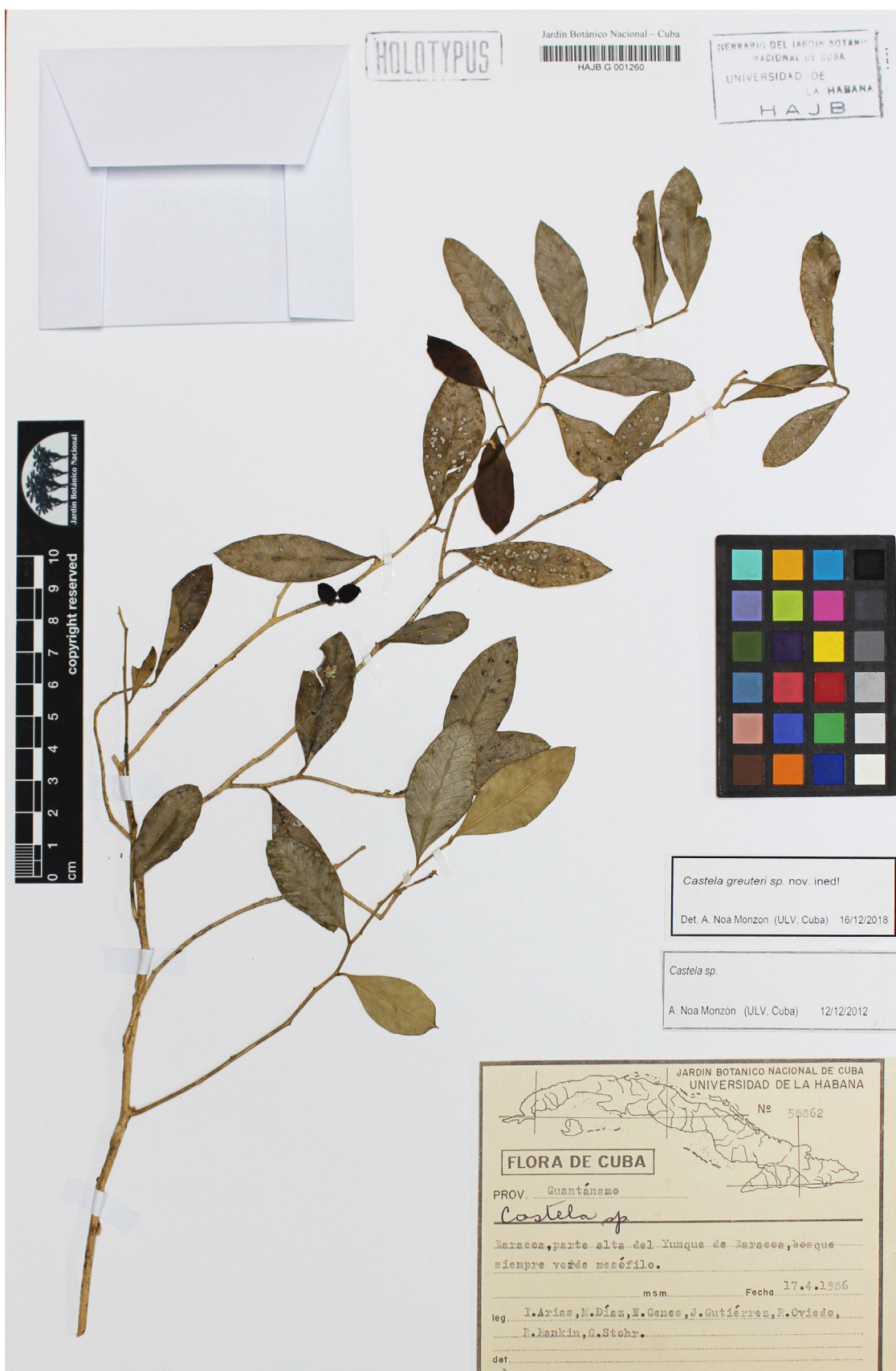
Fig. 3. Holotipo de Castela greuteri , depositado en el Herbario “Prof. Dr. Johannes Bisse” del Jardín Botánico Nacional (HAJB). Fig. 3. Holotype of Castela greuteri , deposited in the Herbarium “Prof. Dr. Johannes Bisse” of the National Botanic Garden (HAJB).