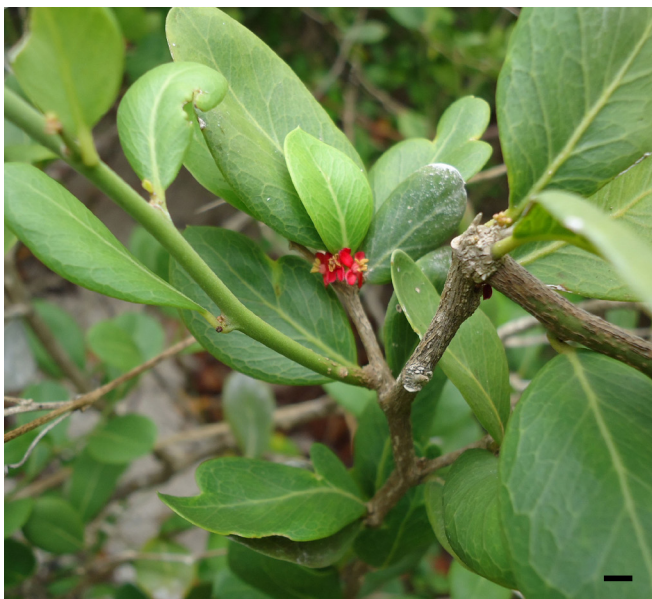
Fig. 10. Castela manitzii , ramas con flores de una planta ♂ procedente del matorral xeromorfo costero al este de Playa Herradura, Las Tunas, Cuba. Barra de escala: 1 cm.

Estado de conservación: La población de Castela manitzii ocupa una extensión de presencia de 5 102 km 2 y un área de ocupación de 8 km 2 . El cambio climático es una amenaza importante sobre la población, ya que habita en áreas