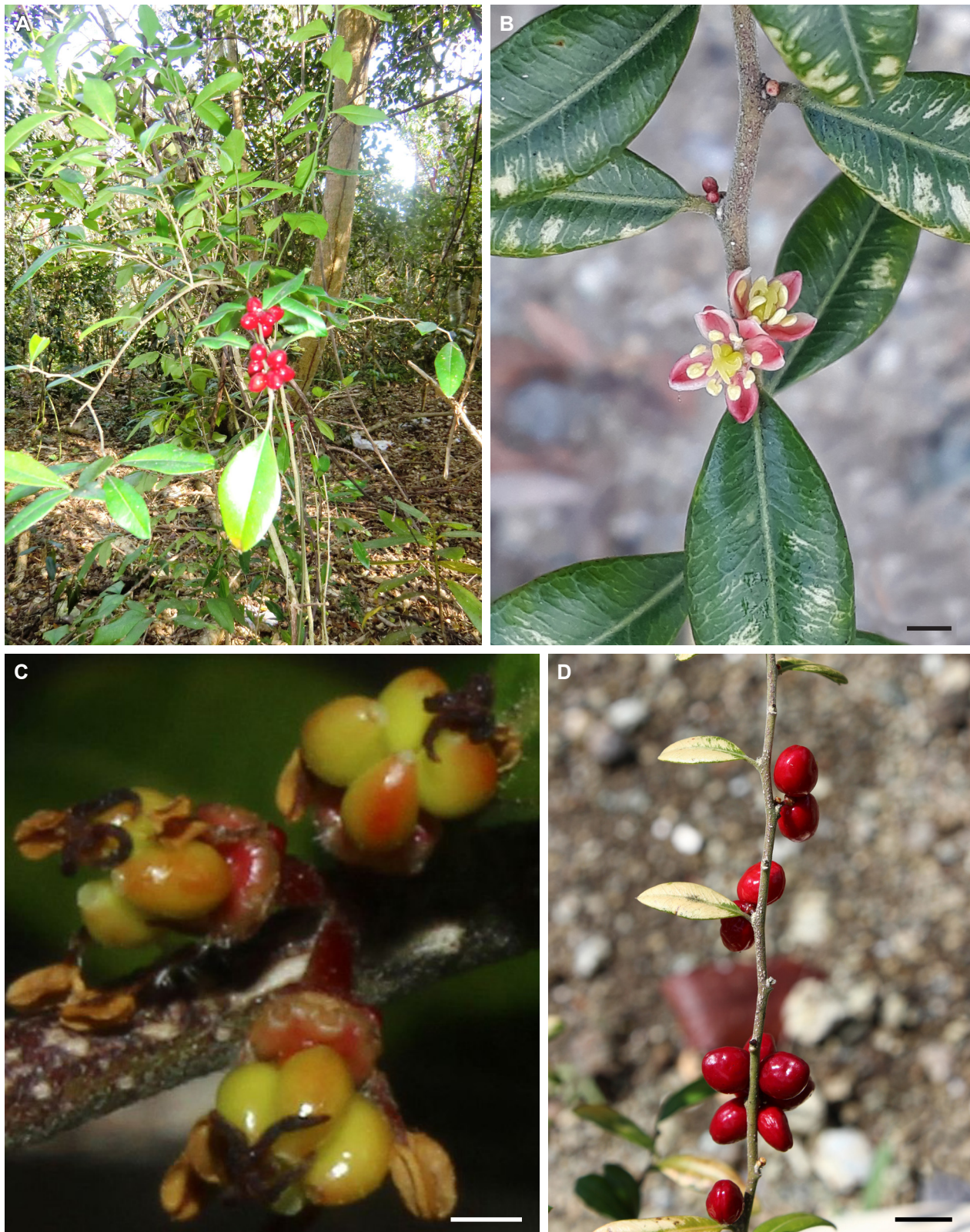
Fig. 4. Castela greuteri . A. Hábito. B. Flor en fase ♂. C. Flor en fase ♀. D. Fruto maduro. Plantas cultivadas en el Jardín Botánico Nacional (A) y el Jardín Botánico de Villa Clara (B-D). Barras de escala: 2 mm (B), 1 mm (C) y 1 cm (D).