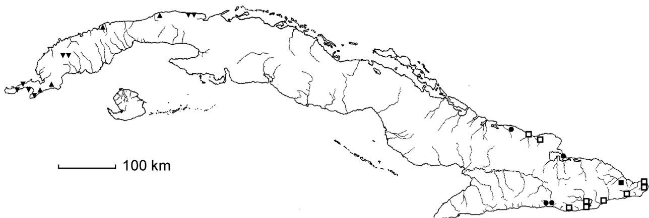
Fig. 5. Distribución de Castela en Cuba: ■ C. greuteri , ▲ C. spinosa , □ C. jacquiniifolia , ▼ C. calcicola y ● C. manitzii .