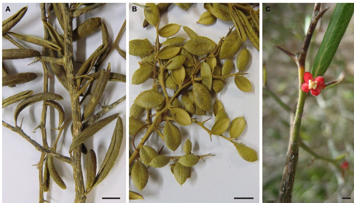
Fig. 7. Castela jacquiniifolia . A-B. Heteromorfía foliar en el espécimen J. Bisse & al. HFC 47583 (B #377856). C. Rama con flor ♂. Barras de escala: 1 cm (A-B) y 2 mm (C).

Estado de conservación: La población de Castela calcicola ocupa una extensión de presencia de 8 935 km 2 y un área de ocupación de 16 km 2 . La población está sometida las intrusiones y disturbios humanos por las actividades recreativas del turismo de playa. El cambio climático es otra amenaza, por habitar en áreas costeras que estarían sometidas a eventos meteorológicos de mayor intensidad y frecuencia, tales como fuertes vientos e inundaciones. La especie habita en menos de cinco localidades y su área de ocupación se estima se encuentre en disminución continua, así como la calidad de su hábitat y el número de individuos maduros. Por esta razón, se ratifica la categoría En Peligro otorgada por Urquiola & al. (2014), aunque aquí no se considera el subcriterio iv bajo B2b, dado que no existe disminución continua del número de localidades o subpoblaciones, por lo que quedaría como B2ab(ii,iii,v).