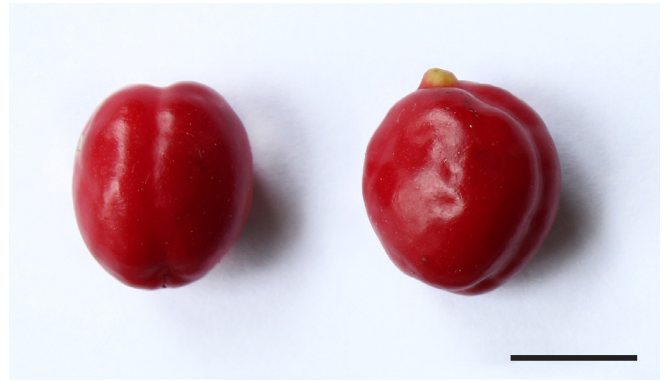
Fig. 1. Frutos maduros casi esféricos de Castela calcicola , provenientes de plantas cultivadas en el Jardín Botánico de Villa Clara. Barra de escala: 1 cm.

El análisis de los tipos y protólogos de Castela calcicola y C. leonis no permite mantenerlas como especies independientes. Acuña & Roig (1950) establecen como diferencias entre ambas especies un fruto globoso en C. leonis y achatado en C. calcicola , lo cual no es consistente, pues los frutos de C. calcicola en sus primeros estadios de desarrollo son achatados y tienden a ser ovoides a esféricos al completar su maduración (Figura 1). Otro elemento utilizado por Acuña & Roig (1950) para considerar C. leonis son las espinas robustas y no ramosas, a diferencia de C. calcicola con espinas ramosas, lo cual se refuta al comprobarse que en ambos casos las espinas pueden ser ramosas y en C. leonis no todas son robustas.