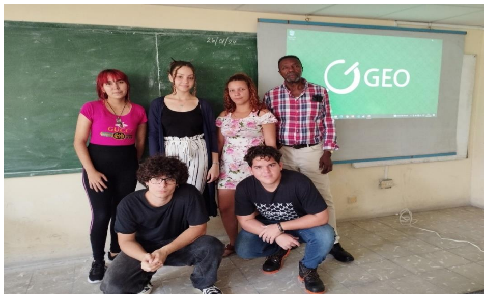
Figura 1. Grupo de estudiantes de segundo año de la carrera de Geografía de la Universidad de la Habana, cursantes de la asignatura Teledetección junto al profesor.

Para cumplimentar este objetivo, desde una óptica académica, se seleccionó e incorporó un grupo de seis estudiantes (Figura 1) del segundo año de la carrera de Geografía de la facultad de igual nombre de la Universidad de La Habana, Cuba, que cursaron la asignatura “Teledetección”, para que asumieran la investigación de igual número de indicadores de ODS de carácter ambiental, con el propósito de contribuir a la formación de su perfil como geógrafos e investigadores en temas de importancia trascendental para el país, como lo es el cumplimiento de la Agenda 2030 y el PNDES hasta el 2030.