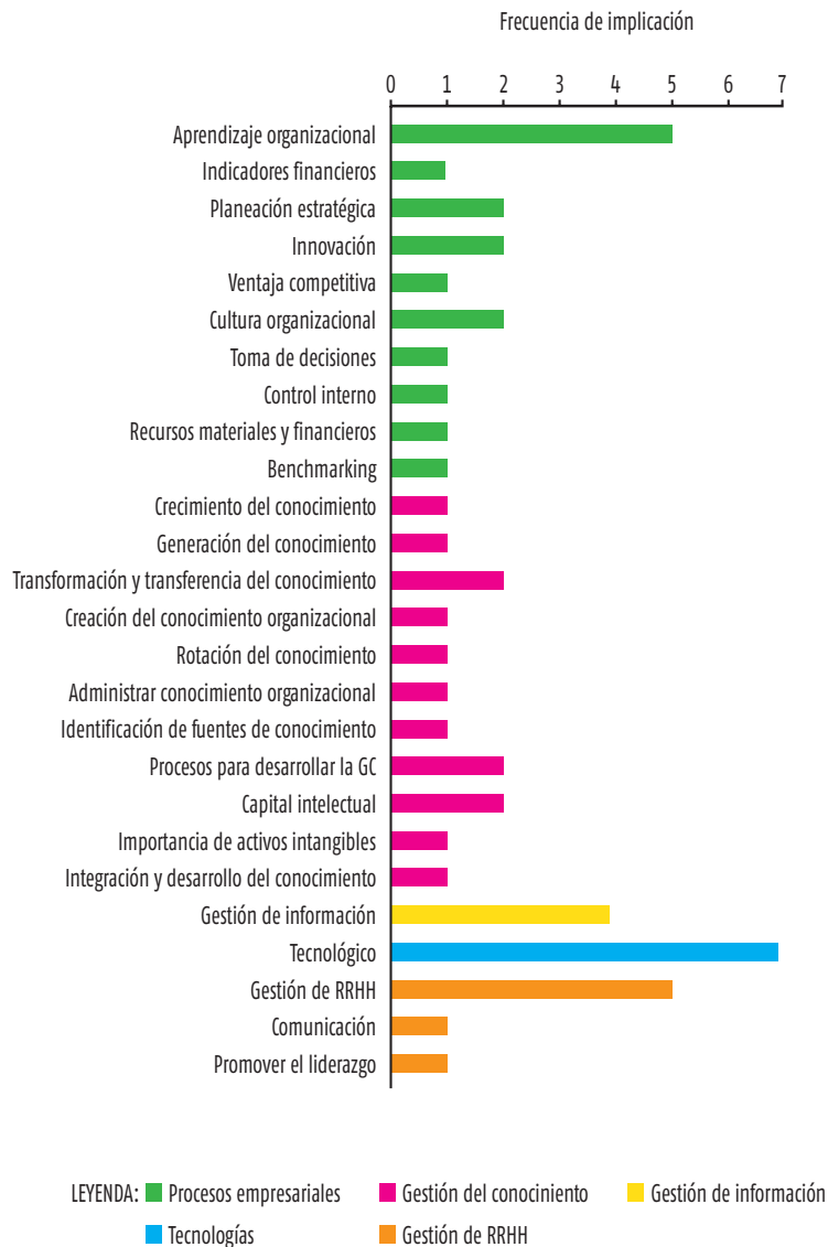
Figura 1. Comportamiento de las variables en modelos (1992-2012).