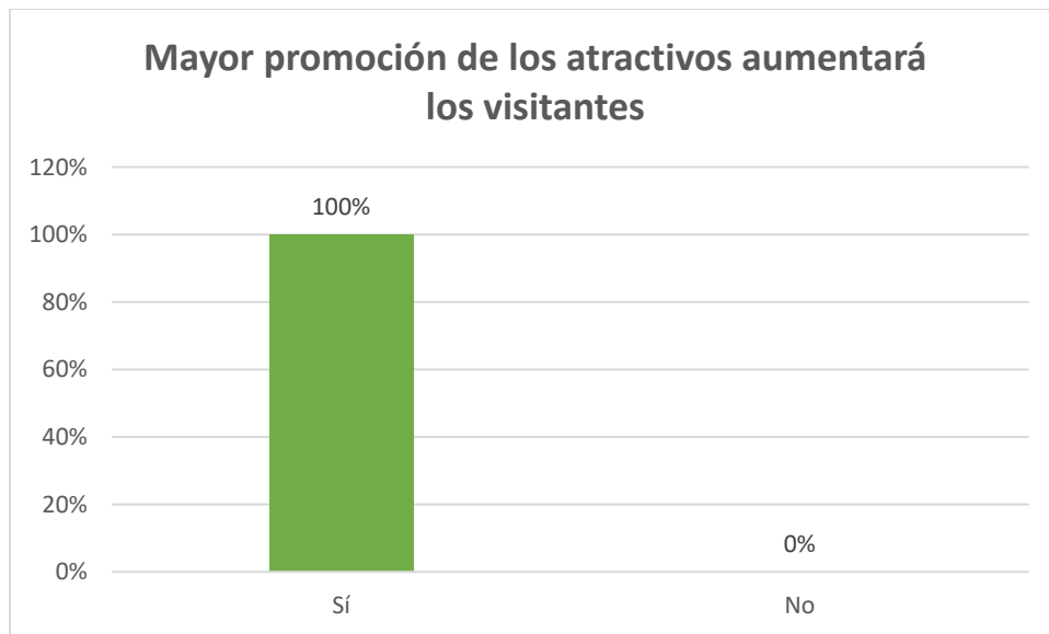
Gráfica 2. Promoción de los atractivos

En esta gráfica, los encuestados a unísono respondieron afirmativamente de que el turismo se convierte en un medio para generar beneficios, no sólo económicos, sino sociales y culturales para esta región.