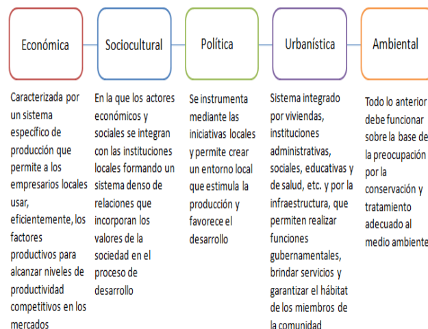
Figura 2: Dimensiones del Desarrollo Local

económica, caracterizada por la utilización eficiente de los factores productivos; otra sociocultural, en que el sistema de relaciones económicas y sociales, las instituciones locales y los valores sirven de base al proceso de desarrollo; otra, urbanística que implica la concepción de un sistema integrado que permita una económica, caracterizada por la utilización eficiente de los factores productivos; otra sociocultural, en que el sistema de relaciones económicas y sociales, las instituciones locales y los valores sirven de base al proceso de desarrollo; otra, urbanística que implica la concepción de un sistema integrado que permita realizar funciones gubernamentales y brindar servicios; y otra, política y administrativa, en que las iniciativas locales crean un entorno local favorable a la producción e impulsan el desarrollo sostenible (Peñate, 2011). Una síntesis de sus dimensiones se representa en la Figura 2.