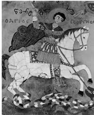
Fig. 1 - San Jorge a caballo, alanceando al dragón, esmalte del siglo xv, en el Museo de Tiflis, Georgia. Nótese las escrituras en griego. Justamente «la jerarquía eclesiástica fue una versión en griego escrita entre los siglos v y vi y que, al parecer, se conservó en el lugar donde se había producido la muerte del santo, en la antigua Dióspolis» (Capalvo, Sancho Menjón, Centellas y Ruiz, 2006).

Sin embargo, en la obra de Cañas (1956), a pesar de que Jorge derrota a Miguel, nombre de referencia también bíblica, al final, durante la etapa de conclusión, no triunfa como Alejandro Magno, con quien, aparte de Eneas, presenta parentesco y, como se observa enseguida, vínculos gráficos (Fig. 1):