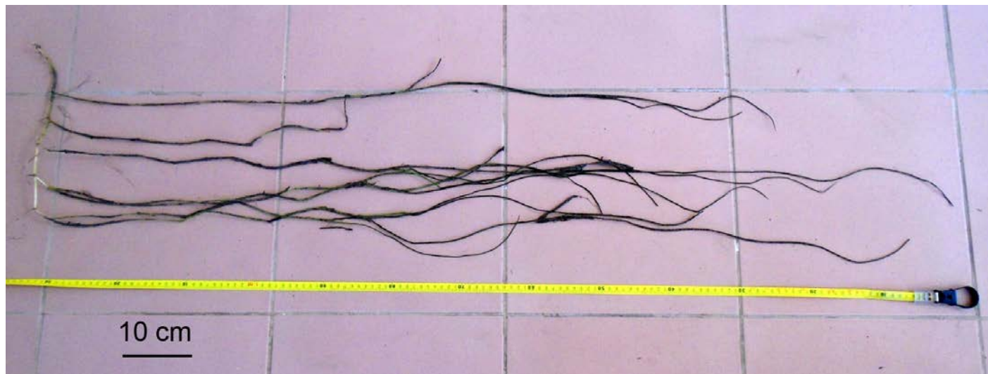
Fig. 3. El fragmento de rizoma de S. filiforme utilizado en el presente trabajo, con cinco haces foliares junto a una cinta métrica como referencia.

Fig. 3. The rhizome fragment of S. filiforme used in the present work, with five leaf shoots together with a measuring tape as a reference.