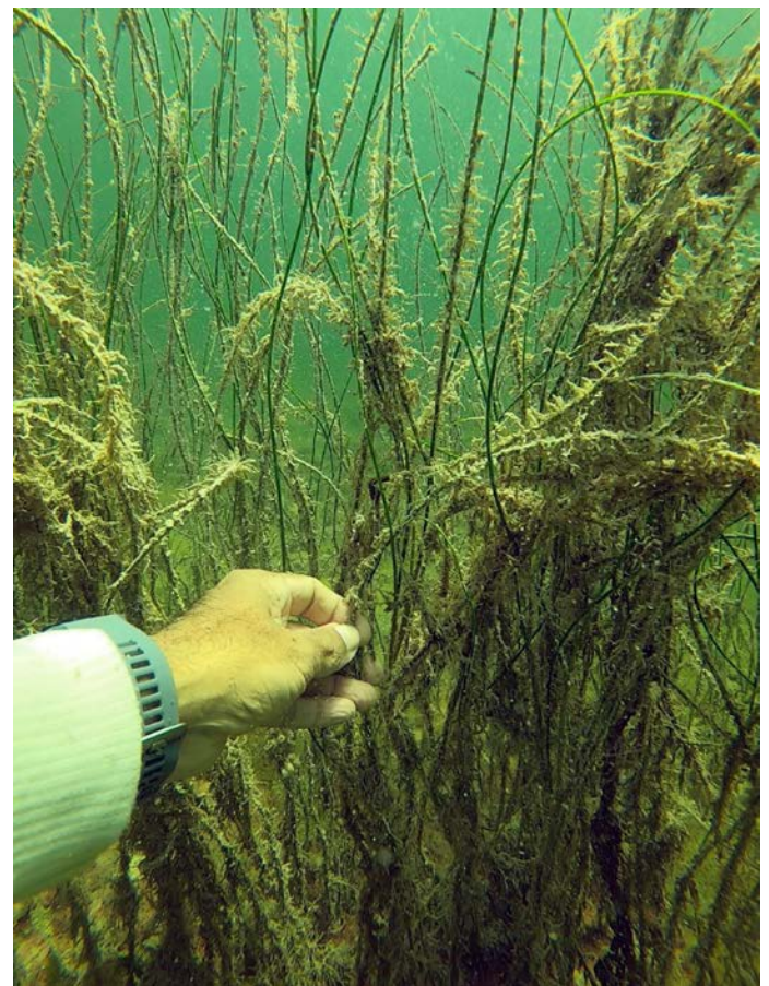
Fig. 2. Perspectiva submarina de la pradera de S. filiforme . Fig. 2. S. filiforme meadow underwater perspective.

Posteriormente se realizó una comparación contra las dimensiones halladas en la literatura científica disponible, luego de una búsqueda en Google Scholar con los términos “ Syringodium filiforme ”, “leaf height”, “leaf length”, “canopy”. Además, se revisaron libros que contienen descripciones de la especie o del género (Den Hartog, 1970; Van Tussenbroek et al. , 2010).