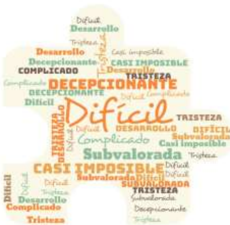
Figura 3. Visiones sobre la Superación Profesional.