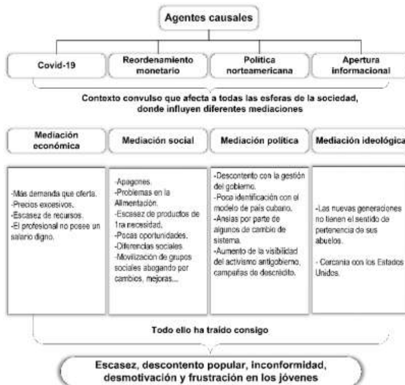
Figura 2. Mediaciones contextuales macro-estructurales.

A continuación se muestran las mediaciones más referidas por los sujetos de la muestra en las técnicas realizadas (ver figura 2).