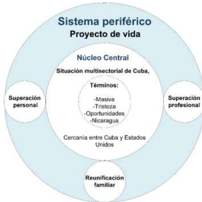
Figura 1. Estructuración del campo de representación.