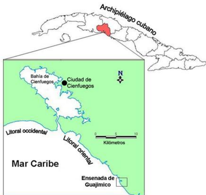
Fig. 1. Litoral de la provincia de Cienfuegos, Cuba.

Las colectas se realizaron en el área de Guajimico, litoral Este de la provincia de Cienfuegos, región centro-sur de Cuba (Fig. 1), específicamente en una pequeña ensenada somera de esa área que tiene uso recreativo. El estudio se realizó en el periodo seco de 2007 (febrero) y posterior a las lluvias (noviembre) de ese mismo año. La temperatura media anual del agua fue de 28.1 °C y la salinidad de 34‰. El fondo de la zona estuvo dominado por macroalgas, así como por la fanerógama Thalassia testudinum Banks ex König y por parches de arena. Las macroalgas más abundantes del área fueron las rodoficeas Ceramium nitens (C. Agardh) J. Agardh y Spyridia clavata Kütz., seguidas por las cloroficeas Bryopsis plumosa (Hud.) C. Agardh y Caulerpa sertularioides (S. G. Gmel) M. Howe, y por la feoficea Padina sp.