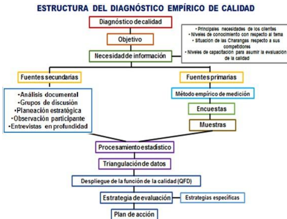
Figura 1. Estructura del diagnóstico empírico de calidad de las Charangas de Bejucal.

La calidad no debe imaginarse como algo estacionario, sino un proceso de mejora continua. Para que ocurra este proceso la gestión de la calidad integra un conjunto de actividades teniendo en cuenta la cooperación de todas las personas implicadas en el desarrollo de la misma, dirigido a obtener resultados significativos y a ofrecer al cliente una mayor satisfacción (Fernández & García, 2023).