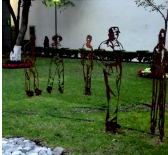
Figura 2. Jardín de esculturas.

Por otra parte, es preciso resaltar edificios emblemáticos y jerarquizados por su función, en los cuales la composición volumétrica, los detalles simbólicos, escultóricos y de diseño gráfico aportan igualmente a la identidad e influyen favorablemente en la comunidad universitaria. Tal es el caso del edificio principal de la dirección de la Facultad (Figura 3).