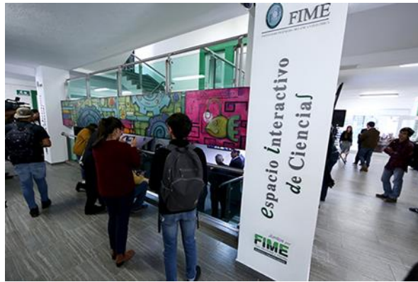
Figura 8. Espacio interactivo de ciencias.