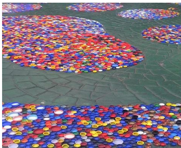
Figura 6. Instalación en espacio público de la FIME.