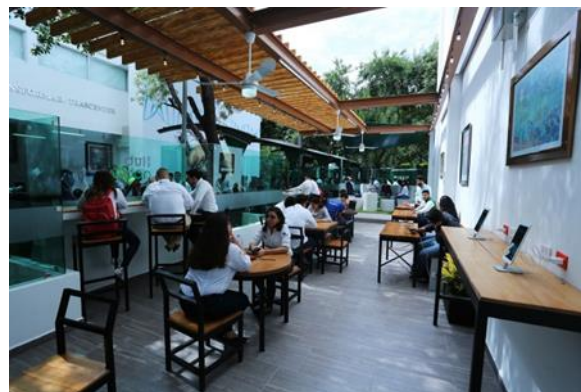
Figura 9. Espacio de convivencia Hub-natura.