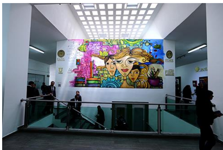
Figura 4. Mural pictórico de ambientación del espacio.

simboliza un emblema de la FIME basado en el reciclaje de tapas plásticas de envases (Figura 6).