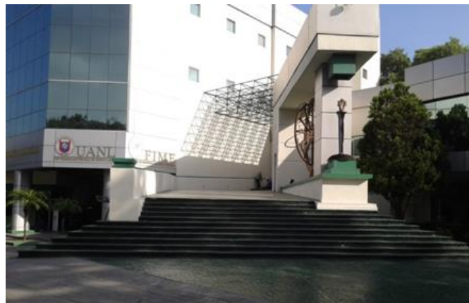
Figura 3. Edificio de la dirección de la FIME.

Por otra parte, es preciso resaltar edificios emblemáticos y jerarquizados por su función, en los cuales la composición volumétrica, los detalles simbólicos, escultóricos y de diseño gráfico aportan igualmente a la identidad e influyen favorablemente en la comunidad universitaria. Tal es el caso del edificio principal de la dirección de la Facultad (Figura 3).