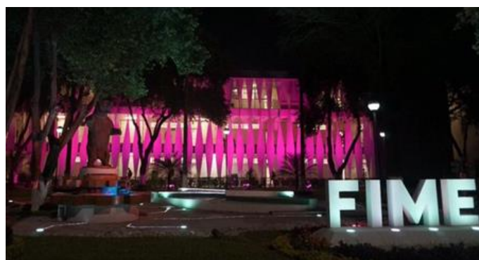
Figura 5. Iluminación artística de edificio en la FIME.