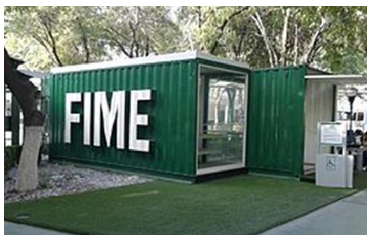
Figura 7. Kiosco FIME-Book.

En el conjunto de ejemplos referidos, se evidencia la participación diversa y comprometida de los actores del proceso enseñanza-aprendizaje, desde los directivos institucionales hasta los estudiantes. Otro ejemplo a referir resulta la adición de un elemento espacial en una zona de mucha actividad social: el módulo FIME-Book, fabricado mediante el reciclaje de contenedores de transporte. Esta pequeña intervención propicia la animación y mejora la ambientación del espacio público. Su función es coherente con la formación cultural integral, pues consiste en un espacio destinado a promover la lectura. Además, su dimensión educativa se refuerza porque estimula el intercambio solidario y responsable de los estudiantes, quienes pueden tomar libremente publicaciones para su lectura y, a su vez, se les convoca a realizar donaciones de otras (Figura 7).