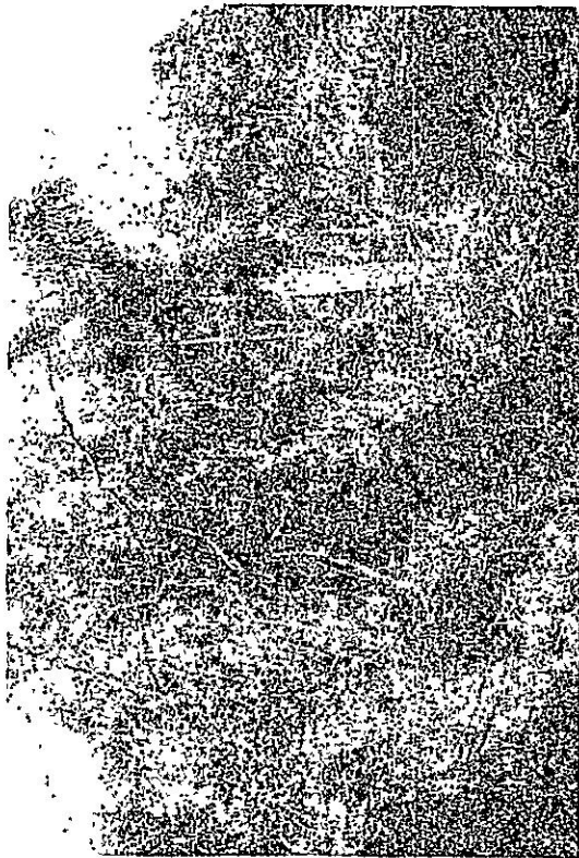
Foto 2 - Una muestra de la vegetación en El Picote.