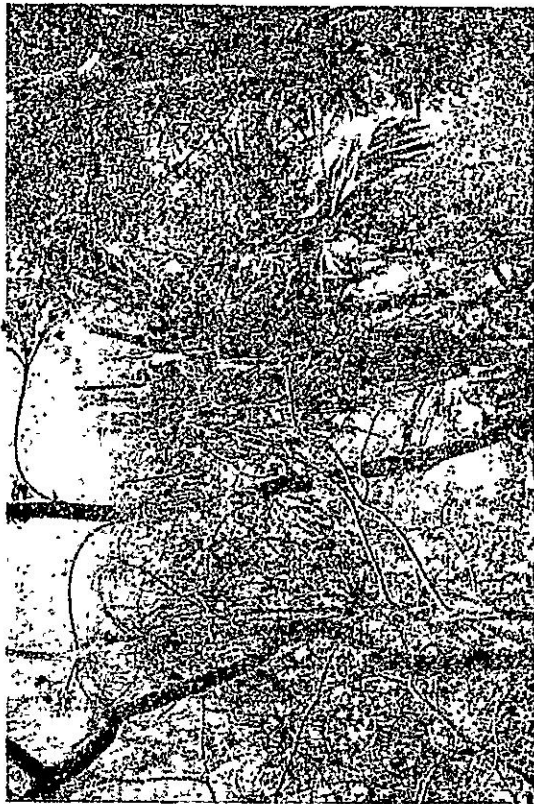
Foto 3 - Algunas de las plantas observadas en los mogotes al sur de Altos de la Estrella: Hemithrinax robusta ; Plumeria filifolia ; Agave shaferi s.l.; etc.