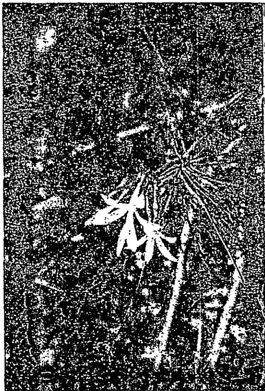
Foto 4 - Plumeria filifolia , detalle de las flores