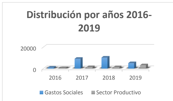
Gráfico 3 Distribución de la Contribución Territorial (U/M – MP)