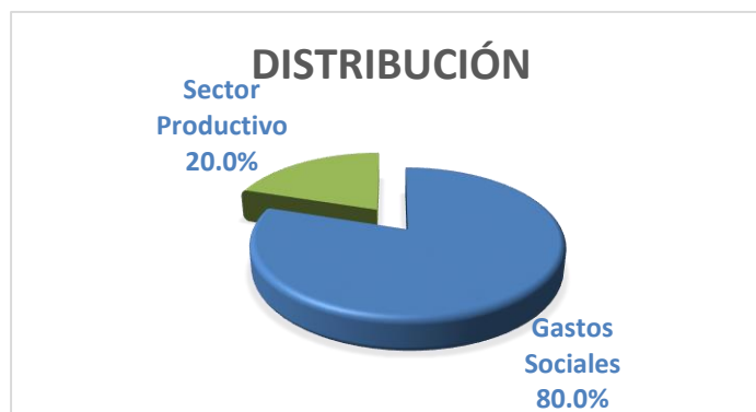
Gráfico 4 Resumen de la distribución de la Contribución Territorial (U/M – MP)

Esta acción no fue dirigida al desarrollo económico en particular y contempla solo un 20 por ciento hacia sectores productivos que, con su propio perfeccionamiento de la tecnología, los servicios, etc., generaran un incremento de estos ingresos en tal tributo, que pueden emplearse con mayor potencialidad hacia el sector social.