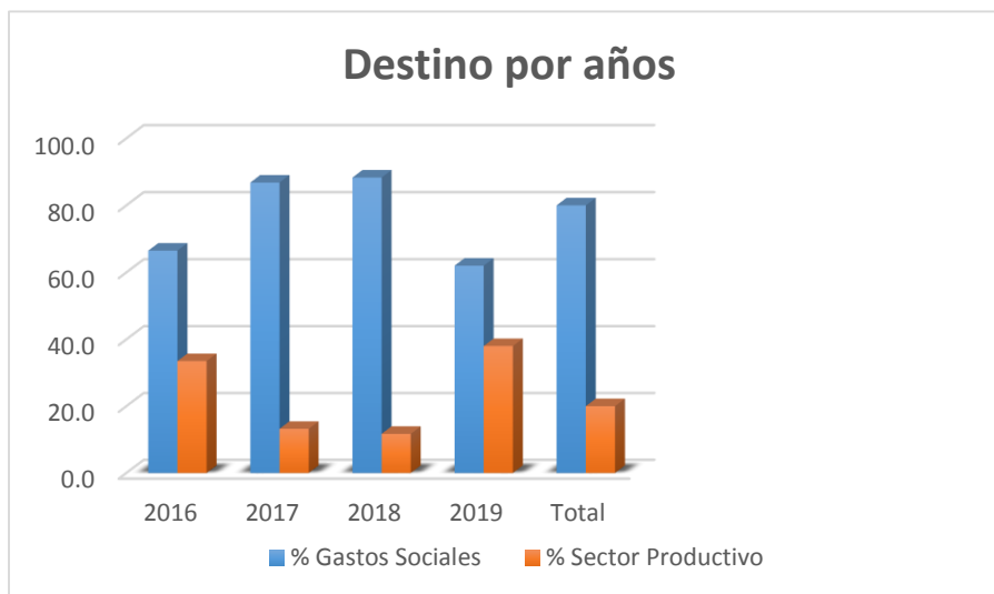
Gráfico 5 Destino de lo recaudado por concepto de la CTDL (U/M - MP)

Fuente: elaborado a partir de datos de la Dirección Provincial de Finanzas y Precios