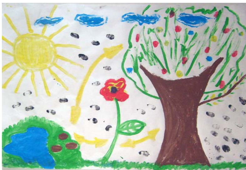
Figura 1. Dibujo colectivo de los jóvenes donde expresan cómo perciben las relaciones entre las generaciones. En la explicación del dibujo se representa simbólicamente cada generación exceptuando a los adultos mayores. Nótese en el dibujo cómo los niños son representados con las semillas, los jóvenes con la flor, los adultos medios con el árbol, y se cierra el ciclo de vida sin una representación gráfica de los adultos mayores.

Las referencias contenían en la mayoría de los casos una actitud negativa aunque solapada hacia la generación de adultos mayores. A nivel de discurso no fueron reconocidas directamente las distancias y evasiones, sin embargo, las técnicas proyectivas sí reflejaron la actitud negativa a través de la exclusión, e incluso la omisión, en algunos casos de los mayores como generación perteneciente al ciclo del desarrollo (figura 1).