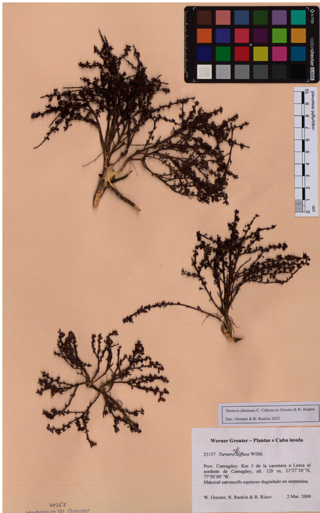
Fig. 2. Holotipo de Turnera diminuta , depositado en el Herbario Mediterráneo (PAL-Gr) del Jardín Botánico, Universidad de Palermo, Italia Fig. 2. Holotype of Turnera diminuta , deposited in the Herbarium Mediterraneum (PAL-Gr) of the Botanical Garden, University of Palermo, Italia.