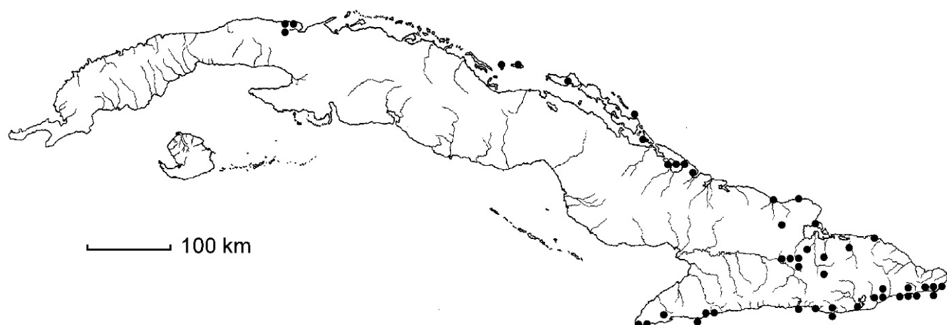
Fig. 3. Distribución de Turnera diminuta en Cuba, basada en materiales de herbario revisados (Anexo 1).