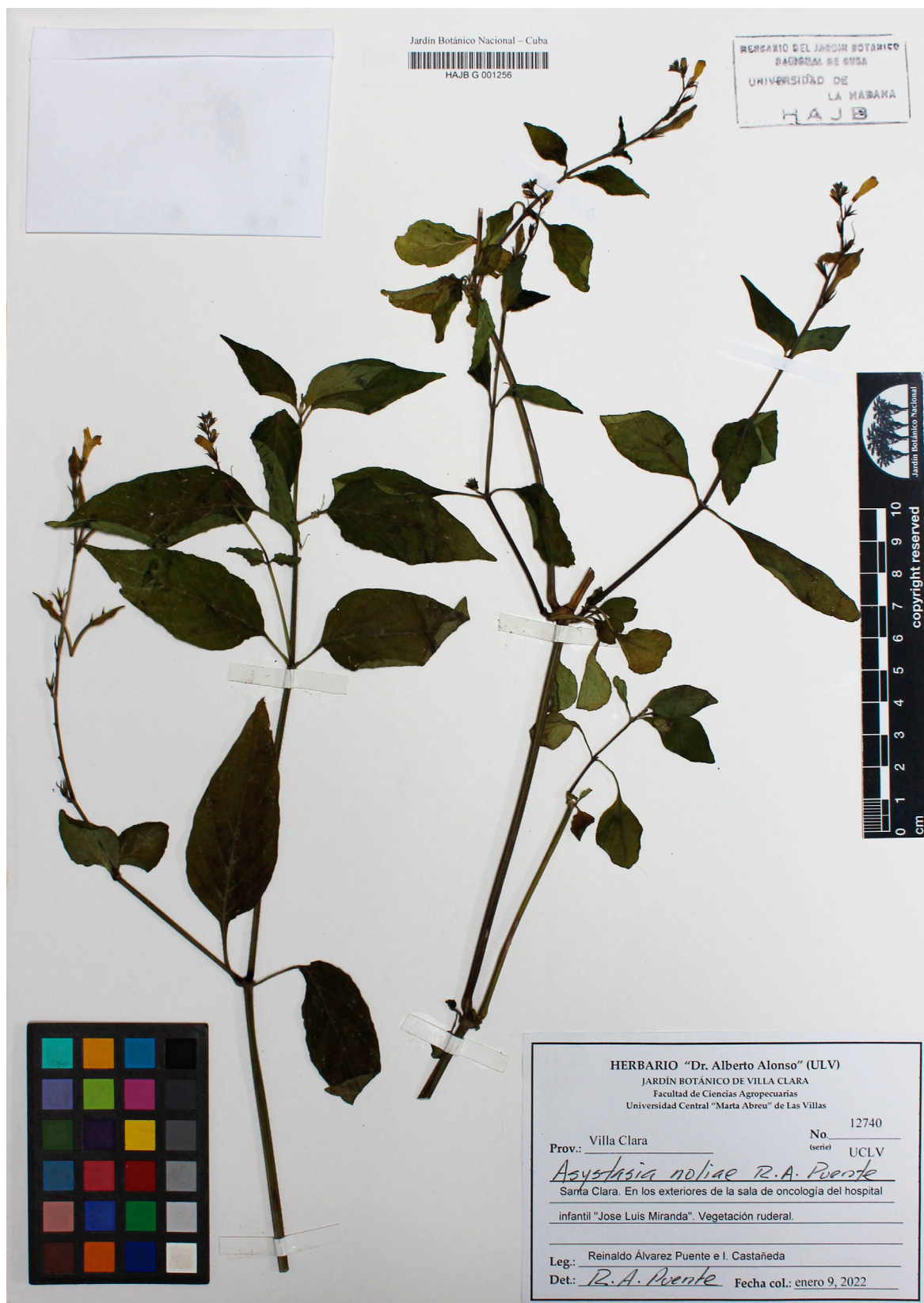
Fig. 1. Holotipo de Asystasia noliae , depositado en el Herbario Johannes Bisse (HAJB) del Jardín Botánico Nacional, Universidad de La Habana, Cuba.