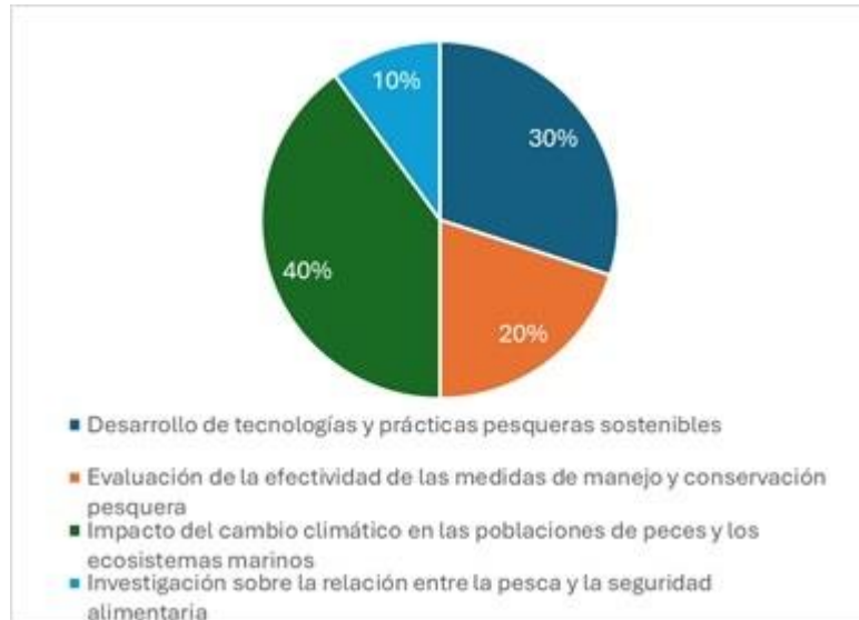
Figura 3. Áreas de investigación más relevantes o urgentes.

para la investigación, como el impacto del cambio climático en las poblaciones de peces y la necesidad de desarrollar tecnologías pesqueras sostenibles (ver figura 3).