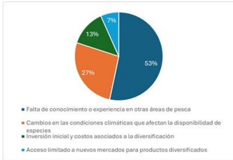
Figura 5. Principales desafíos para diversificar su actividad