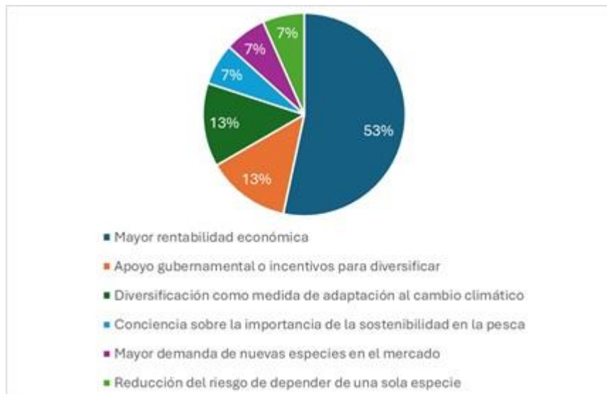
Figura 4. Factores que motivarían a diversificar su actividad pesquera.

de diferentes especies, sino también a la incorporación de nuevas prácticas y productos en el mercado. La Figura 4, ilustra los factores que los pescadores consideran más relevantes para diversificar su actividad, lo que incluye incorporar productos que generen mayor rentabilidad económica y el apoyo gubernamental o incentivos que fomenten la diversificación.