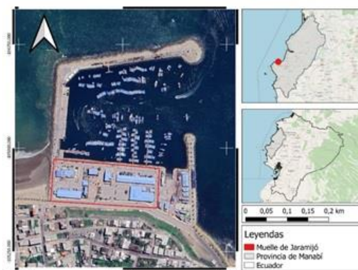
Figura 1. Mapa de ubicación del Muelle de Jaramijó.

Para las autoridades, se seleccionó a la persona de mayor rango jerárquico. Se intentó entrevistar a la mayor cantidad posible de comerciantes y pescadores del muelle, así como a consumidores que adquieren productos pesqueros de Jaramijó. El método de entrevistas siguió el enfoque de Spradley (1979) que utiliza habilidades comunicativas del investigador para recopilar información relevante sin una muestra estadística definida.