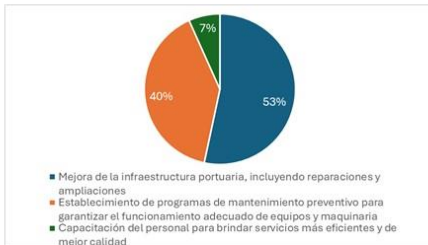
Figura 6. Necesidades de mejoras portuarias.

La infraestructura portuaria y la logística son aspectos fundamentales para el desarrollo de la pesca en Jaramijó. Los pescadores y comerciantes señalaron que la falta de instalaciones adecuadas y de servicios logísticos eficientes limita su capacidad para operar de manera efectiva. La figura 6 ilustra los principales desafíos que enfrenta la comunidad en términos de infraestructura, subrayando la necesidad de inversiones en este ámbito para mejorar la sostenibilidad de las prácticas pesqueras.