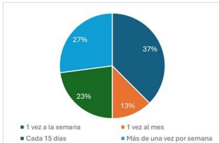
Figura 2. Frecuencia con la que compra productos pesqueros.

Los comerciantes, que juegan un papel crucial en la cadena de suministro, enfrentan varios desafíos. Aunque un 43% de ellos verifica que los productos provengan de fuentes sostenibles, más del 70% no considera necesario pagar un precio más alto por productos certificados. Esto sugiere una falta de incentivos económicos para adoptar prácticas más responsables en la cadena de suministro, aspecto sugerido por todos los actores a ser implementado.