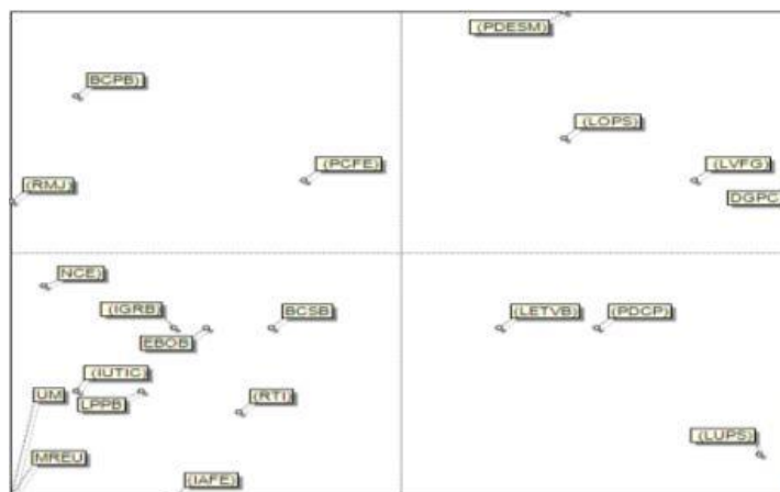
Figura 1. Matriz de influencia - dependencia directa entre variables.

El análisis en el MICMAC se basó en variables determinadas en investigaciones anteriores, por lo que los resultados fueron muy semejantes en ambas empresas. A partir del mapa de la Matriz de influencia - dependencia directa se determinaron las variables motrices y las variables de enlace (Figura 1).