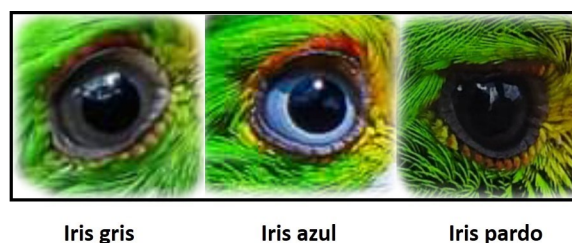
Figura 1. Colores del iris en los ojos de Todus multicolor en Cuba.

El análisis detallado del close up de los ojos de Todus multicolor reveló la presencia de tres colores diferentes para el iris: gris, azul y pardo (Figura.1)