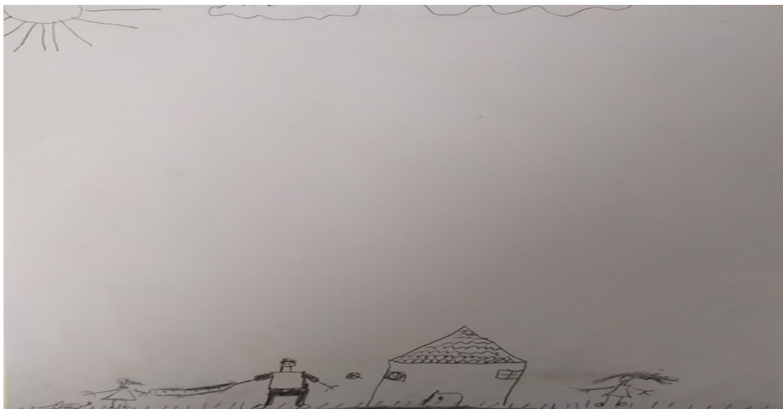
Figura 1. El uso de algunos métodos de castigo como el cinto fue manifestado por las niñas y los niños en los dibujos.

La investigación no indagó con profundidad en los niños y las niñas y las secuelas del maltrato, lo que quedará como una recomendación para investigaciones que continúen la línea temática. Con la aplicación de la técnica proyectiva (historieta de Madeleine Thomas) se evidenció que las madres y los padres no brindaron en sus respuestas al cuestionario toda la información sobre las prácticas que son consideradas maltrato porque vulneran los derechos de los niños y las niñas, incluyen las más tradicionales formas de castigo físico y que sus hijas e hijos sí consideran como tal, a partir de las vivencias que reflejaron (figura 1).