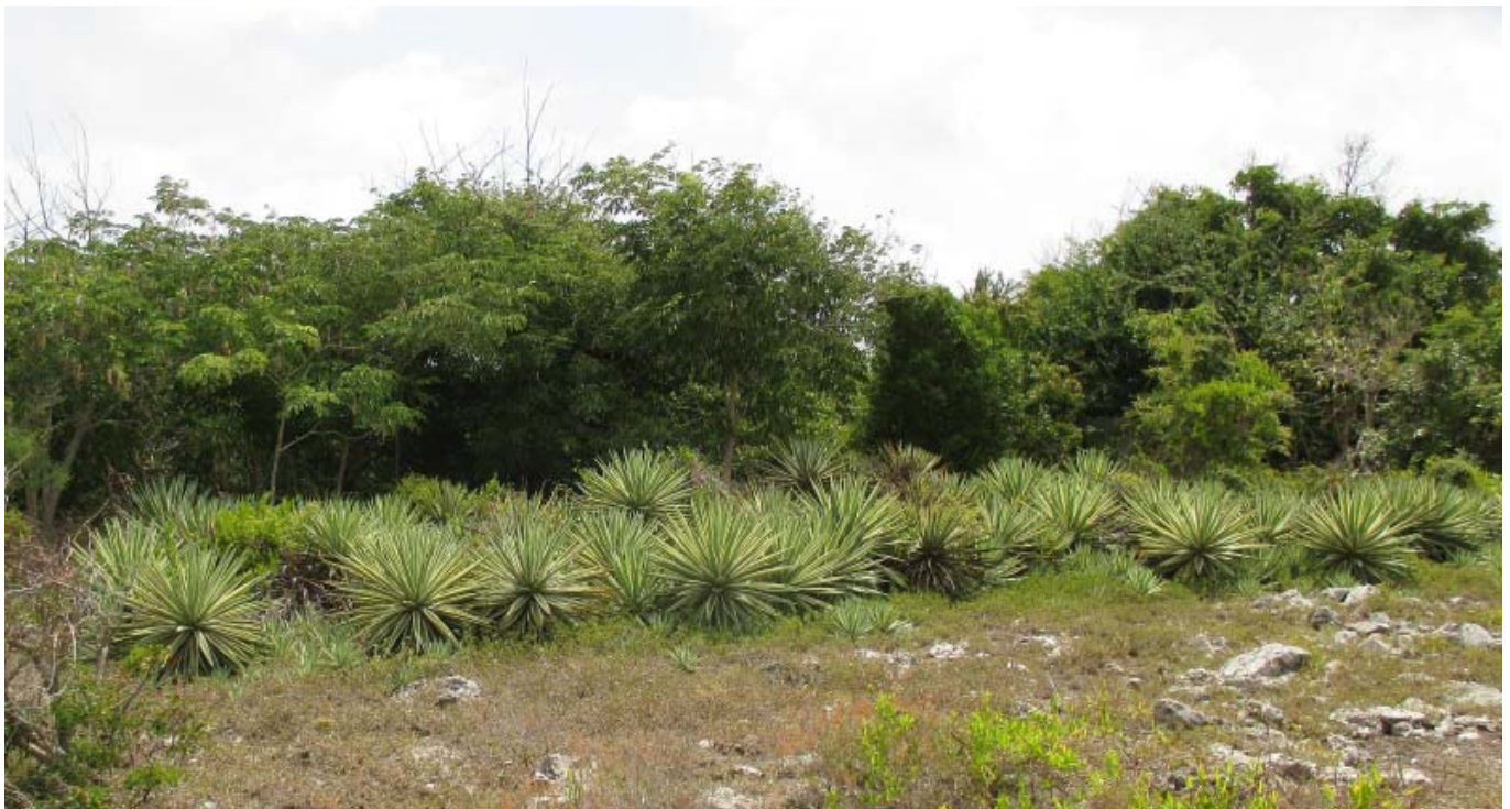
Fig. 3. Agave vivipara en un parche de vegetación secundaria de la franja de costa entre el Embarcadero de Río Seco y Punta Caleta Honda, municipio Banes, provincia Holguín, Cuba.

Resulta, además, interesante el hallazgo de un individuo de Scaevola sericea en el complejo de costa arenosa. Esta especie es nativa de África, Asia, Australia e islas del Pacífico y considerada exótica invasora en Cuba (Oviedo & González-Oliva 2015) y otras islas del Caribe como Bahamas e Islas Vírgenes (Acevedo-Rodríguez &