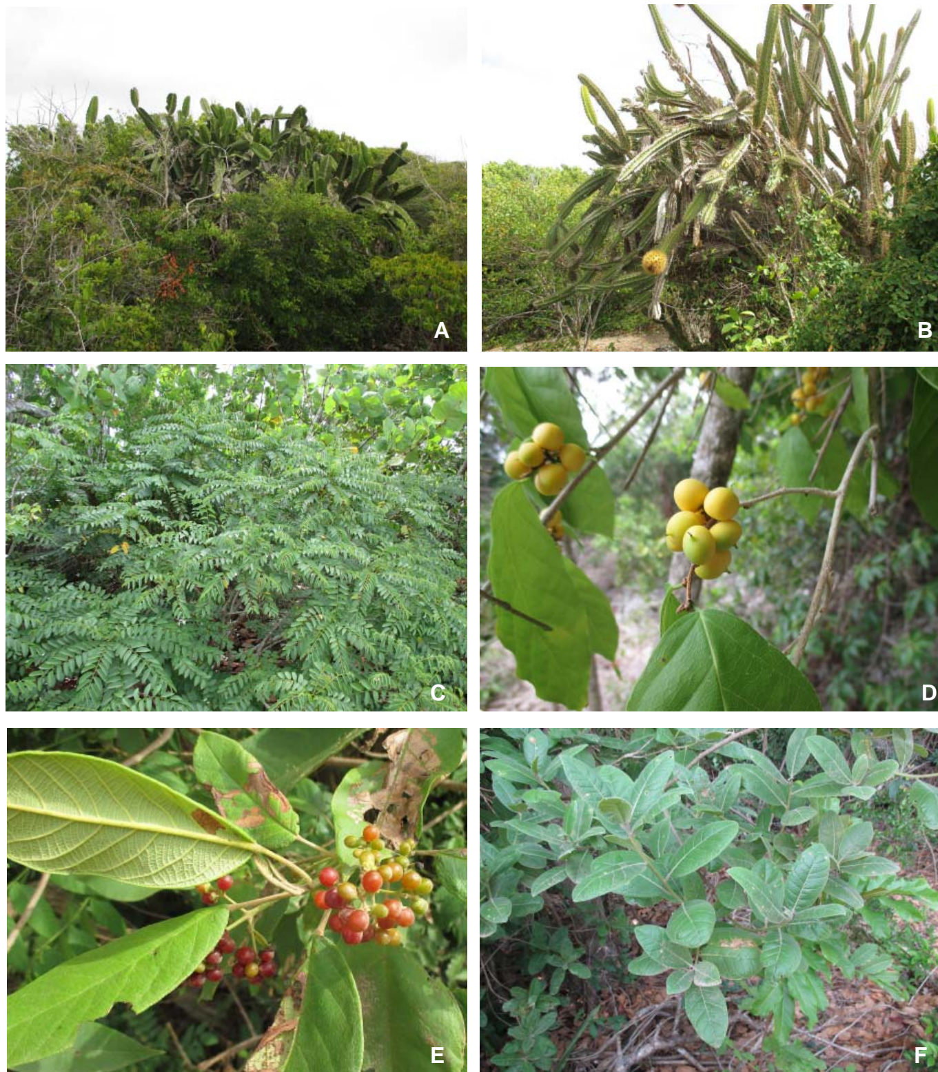
Fig. 2. A. Árbol de Dendrocereus nudiflorus . B. Leptocereus santamarinae con fruto. C. Phyllanthus juglandifolius en el complejo de vegetación de costa arenosa. D. Rama de Ampelocera cubensis con fruto. E. Rama de Petitia domingensis con frutos. F. Rama de Terminalia eriostachya .