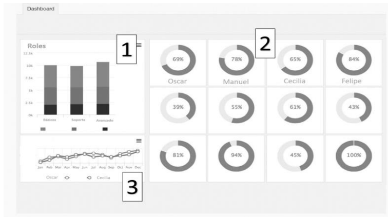
Figura 1. Diseño de dashboard para el análisis grupal de portafolios.