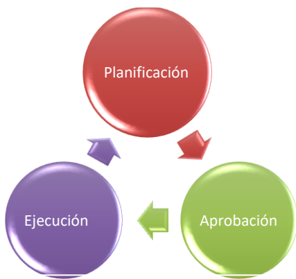
FIGURA 1 ETAPAS DEL PROCESO PRESUPUESTARIO

Es un proceso continuo, conformado por las etapas de planificación, aprobación y ejecución del Presupuesto del Estado que comprende las tareas asociadas a la elaboración, notificación, desagregación, programación, ejecución, control y liquidación del Presupuesto del Estado, todas interrelacionadas entre sí, con la característica de que varias se están realizando en el mismo período de tiempo.