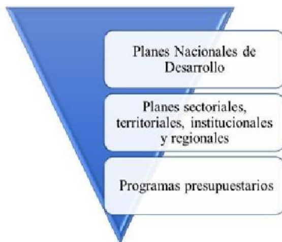
Figura 1. Planificación en cascada.

La técnica programática ofrece una amplia gama de beneficios potenciales a los actores involucrados en el ejercicio presupuestario. Según Diamond (2003), esta metodología contribuye al fortalecimiento de la alineación entre las prioridades políticas del gobierno y la asignación presupuestaria. La interconexión queda representada a partir de una especie de planificación en cascada, donde en el nivel superior se ubican los Planes Nacionales de Desarrollo (PND) y en el nivel inferior está la estructura programática (organización donde se asigna el presupuesto). La presupuestación por programas toma como punto de referencia la planificación a largo plazo. En ese sentido, los recursos fiscales distribuidos tienen como fin el cumplimiento de los objetivos de los programas presupuestarios; estos objetivos responden a otros de más alto nivel declarados en los planes sectoriales, territoriales, institucionales y regionales que, a su vez, responden a los objetivos de los PND (Figura 1).