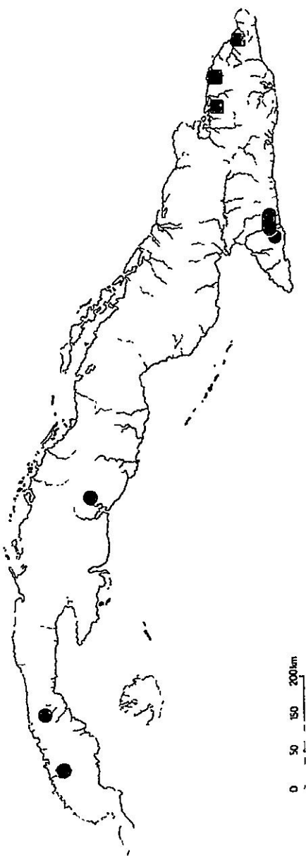
Karte 2: Verbreitung von Brachionidium sherringii ROLFE ■ und Macradenia lutescens R. BR. ● auf Cuba.