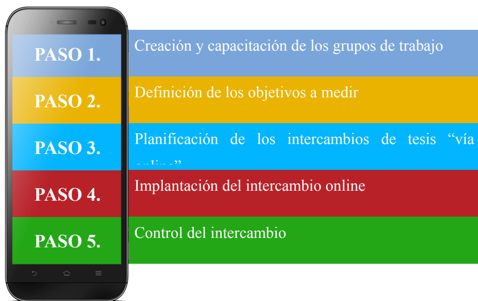
Figura 1. Metodología para la gestión de la culminación de estudio vía online.

Se diseñó una metodología adaptada al sistema de educación superior cubano. Se basa en las resoluciones legales dictadas por el país, rectoras del trabajo docente en las Instituciones de Educación Superior. En la figura 1 se pueden apreciar los pasos de la metodología.