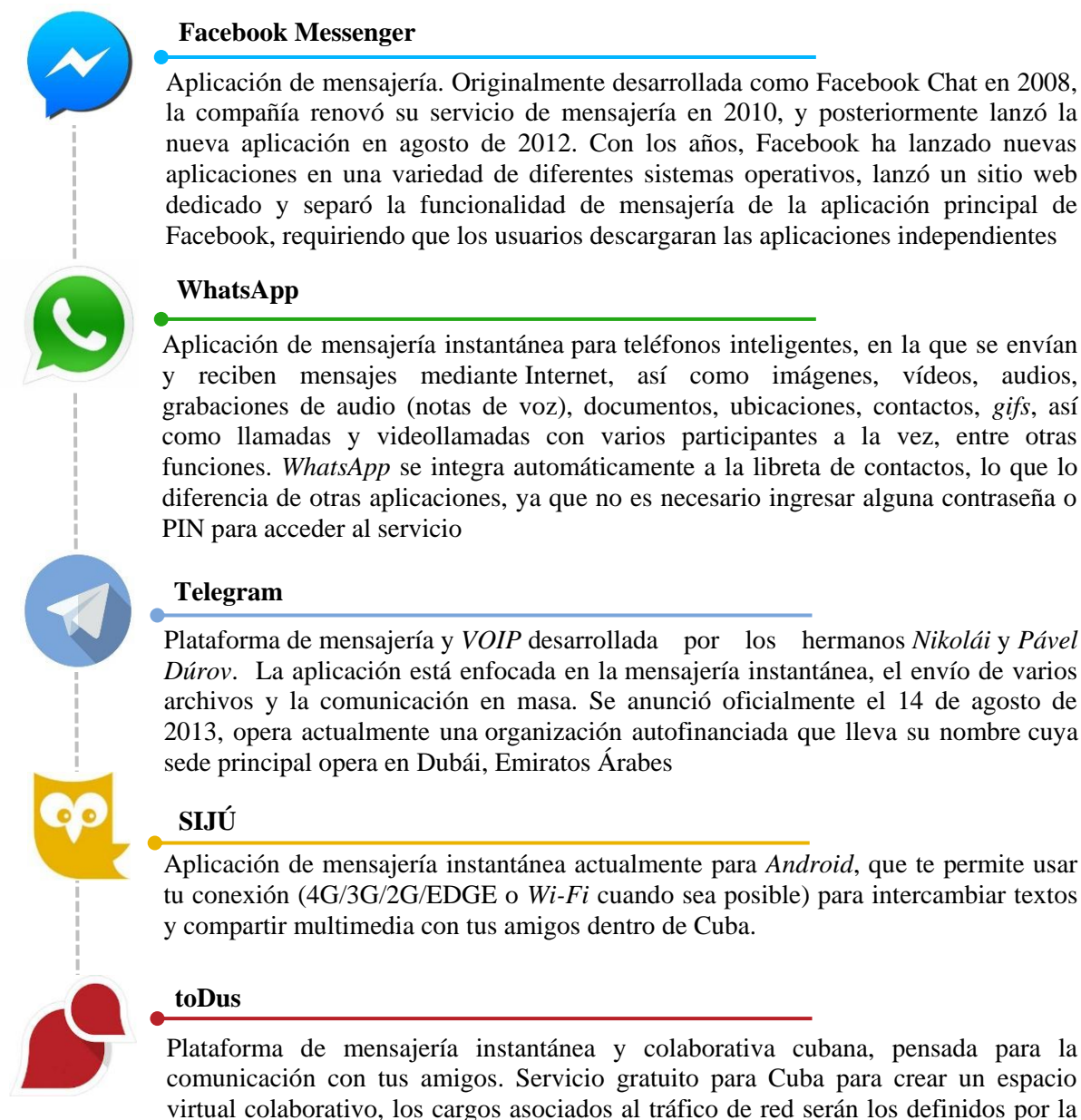
Figura 2. Descripción de las aplicaciones propuestas.