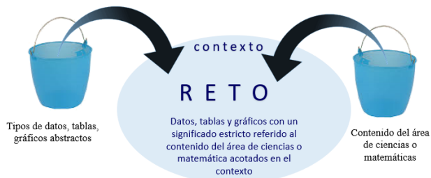
Figura 3: Relación del contenido del área de ciencias o matemáticas con el contenido referido a datos, tablas y gráficos.

Esta situación se enfocará, de modo tal, que los datos en tablas y gráficos sean herramientas para describir dicha situación, así los datos, las tablas y los gráficos entrarán de modo transversal en cada reto, y es allí donde adquieren un significado estricto. Figura 3