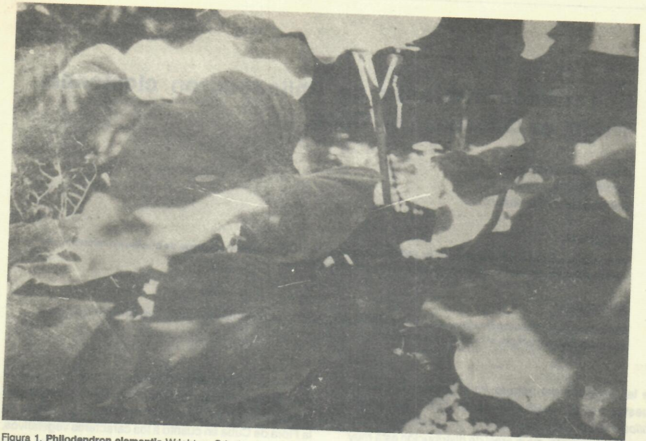
Figura 1. Philodendron clementis Wright ex Grisebach.