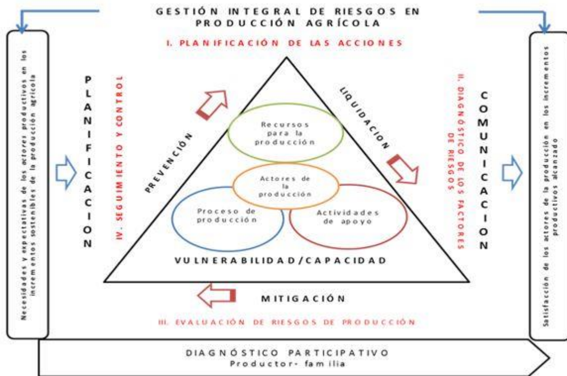
Figura 1. Modelo de gestión integral de riesgos para la base productiva agrícola cubana (MGERA).

La comunicación y la planificación, como procesos inscritos, garantizan la organización, la interacción y el intercambio constante de información, lo que facilita la relación entre los diversos actores involucrados y la orientación, de manera sistemática, en función de la toma de decisiones bajo condiciones de riesgo.