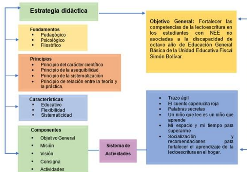
Figura 1. Representación gráfica de la estrategia didáctica.