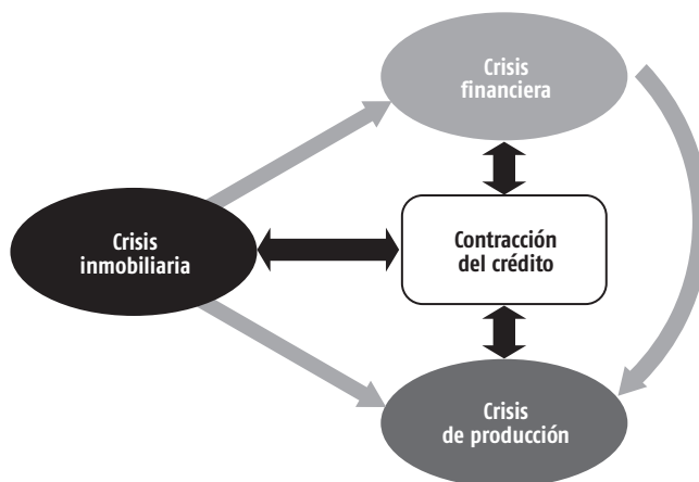
Figura 1. La contracción del crédito como resultado de crisis en elementos centrales en la economía capitalista actual.

Al dar créditos baratos e irresponsables se relajan los requisitos para prestar; el negocio ya no es cobrar el inicial de la deuda más los intereses, sino vender la deuda a otro que también la venderá, así como apostar, como en casino, por el futuro de ese activo ficticio de manera casi ilimitada. Una parte de los que han perdido los créditos lo hacen para financiar la compra de activos reales (una casa, un carro, sus gastos corrientes), pero cuando el endeudamiento ha sido tanto que no se puede pagar todo, entonces, se convierte en moroso. Cuando un prestatario deja de pagar, no solo disminuye el ingreso de los bancos, sino que se envía la señal de que algo no está bien, cuando ese moroso se multiplica por miles el problema se amplifica.