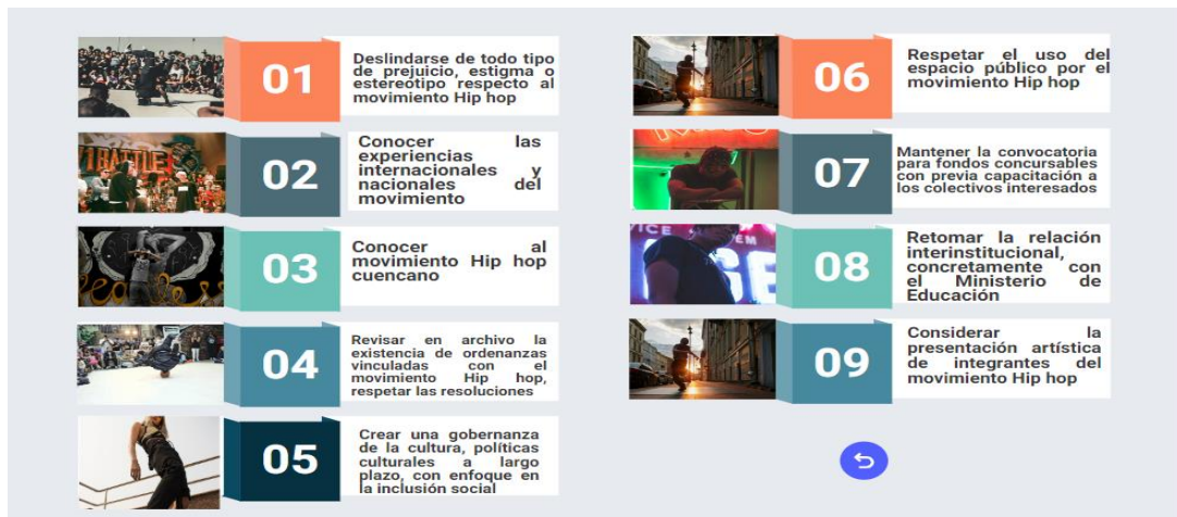
Fig. 2 – Premisas básicas para implementar la propuesta.