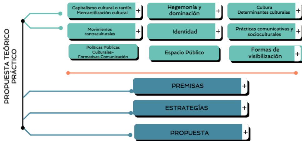
Fig. 1 – Representación gráfica de la propuesta.