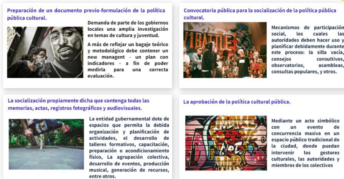
Fig. 4 – Propuesta para la formulación de políticas públicas.