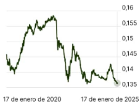
Gráfico 1 Tipo de cambio Yuan – Dólar estadounidense (Enero 2020 – Enero 2025)

Sin embargo, en 2022, debido a la reducción del crecimiento, las persistentes restricciones asociadas a la Covid y la debilidad mostrada por el sector inmobiliario, la moneda china fue una de las que más se depreció frente al dólar y otras divisas. (BIS, 2021). Desde entonces, con altos y bajos, de manera general se ha mantenido la tendencia a la depreciación. (Gráfico 1)