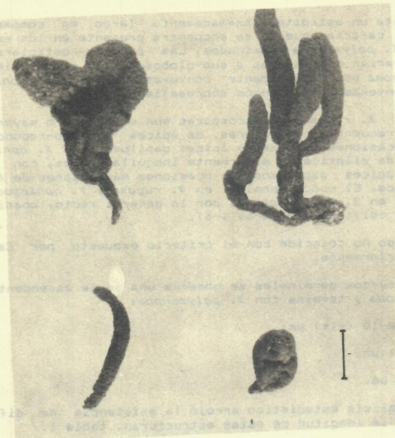
Tabla 1. Valores medios de la longitud (µm) de los surcos germinales analizados.