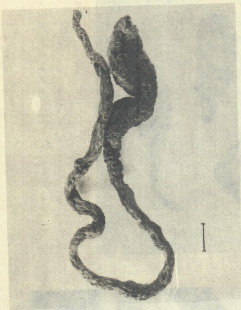
Figura 5. X. ophiopoda . Estromas; línea = 1 cm.