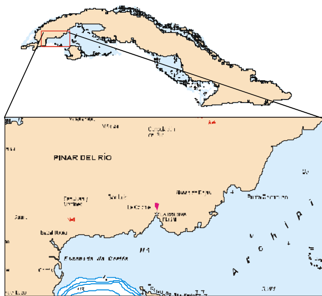
Fig. 1 Zona Costera de estudio. Sur de Pinar del Río, Cuba.

La información sobre economía y población fue obtenida de los Atlas Nacionales de Cuba del 1978 y 1988 (Instituto Cubano de Geodesia y Cartografía, 1978; Instituto de Geografía e Instituto Cubano de Geodesia y Cartografía, 1988), así como del Anuario Estadístico (Oficina Nacional de Estadística, 2001). Además fueron utilizados los resultados de Rodríguez (2002, 2003) y Piñeiro (2002) sobre estudios comunitarios y población de la región. En este aspecto, se utilizaron diferentes métodos teóricos tales como el análisis histórico y los métodos empíricos: revisión bibliográfica, observación y entrevistas (grupales o individuales) (Rodríguez, 2003).