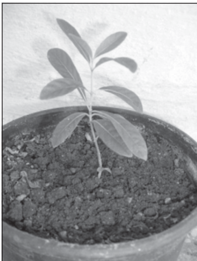
Fig. 8. Guettarda undulata obtenida de semilla germinada en octubre del año 2007. Jardín Botánico de Matanzas.