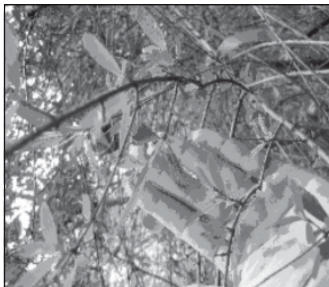
Fig. 7 Guettarda undulata tomada en Peñón de Musulmanes, Varadero.

En los muestreos realizados por los autores en la costa norte de Matanzas la especie fue observada solamente en la Reserva Ecológica “Varahicacos”, Varadero, específicamente en el área denominada Musulmanes, con una población de 27 individuos solamente; el hábitat de la especie se encuentra alterado por la destrucción de las formaciones vegetales en las zonas próximas al área donde se localiza la especie y la construcción de nuevos hoteles.