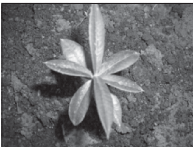
Fig. 13. Garcinia aristata . Jardín Botánico de Matanzas.

El 66,6% de las plantas se mantienen (Tabla III); el desarrollo es lento, en un año el promedio de crecimiento fue de 2,4 cm (Figura 13).