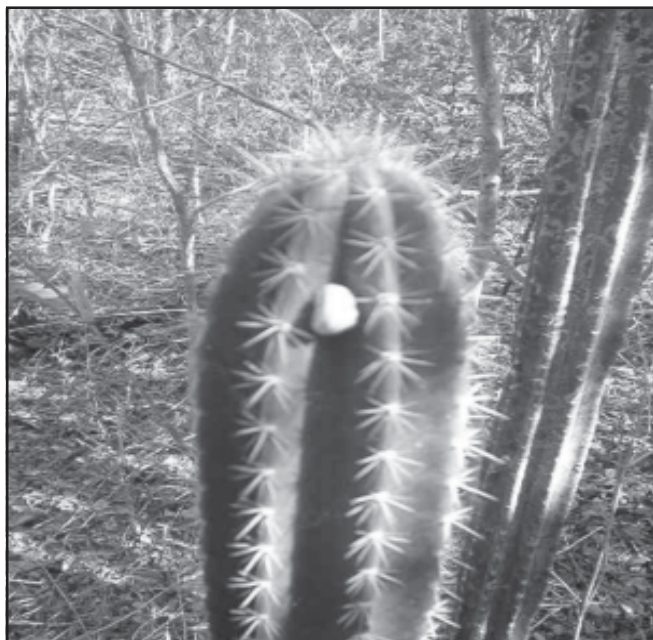
Fig.9. Pilosocereus robinii . Rincón Francés, Varadero.

Flores verdosas de 5 cm de longitud. Fruto globoso, purpúreo, de 4 cm de diámetro; semillas negras brillantes (Alain 1953).