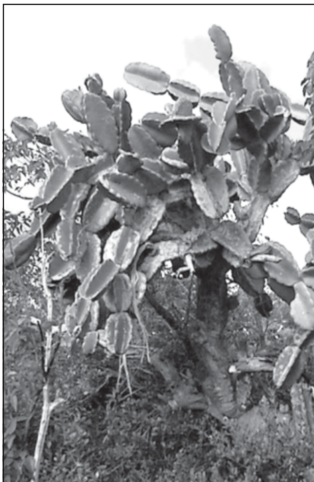
Fig. 5. Dendrocereus nudiflorus , "Varahicacos", Varadero.

Las flores son apicales de 6-8 cm de largo, de color verde pálido o amarillento. Son visitadas por insectos de hábitos nocturnos. No se observan plantas juveniles en el campo (Ramírez 2004). El fruto es una baya carnosa, globosa, verde al madurar, con corteza coriácea y carente de espinas (Gutiérrez 1984).