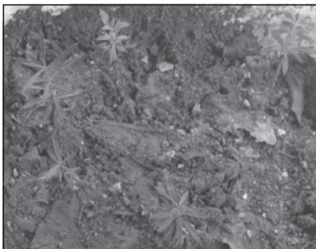
Fig. 14. Jacquinia brunnescens . Plántulas obtenidas de semillas germinadas, Jardín Botánico de Matanzas.

Jacquinia brunnescens Urb., "Espuela de Caballero", (Figura 14). Familia Theophrastaceae