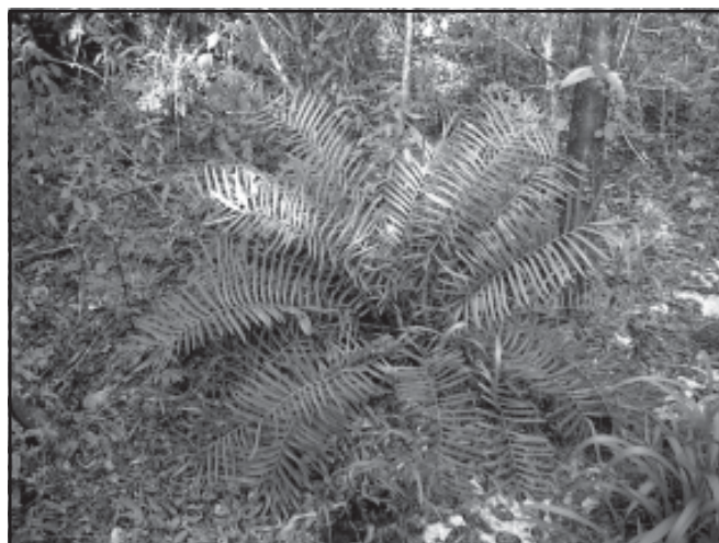
Fig. 10. Zamia integrifolia . Reserva Ecológica "Varahicacos", Varadero

En las zonas muestreadas por los autores la especie fue observada sobre carso parcialmente desnudo, en matorral xeromorfo costero; formando grupos de número variable de plantas en Varahicacos, Rincón Francés, península de Hicacos, Varadero y en el área protegida "Valle del río Canímar".