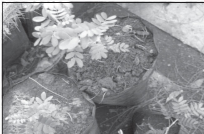
Fig 12. Guaiacum sanctum . Vivero Jardín Botánico de Mantanzas (Foto: L. Robledo).

Tres de las posturas plantadas (50%) (Tabla III), se mantienen en el vivero del JBM, (Figura 12).