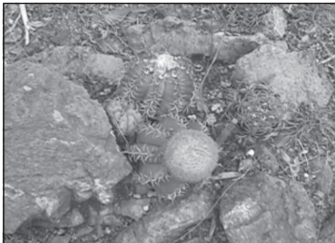
Fig. 1. Melocactus matanzanus "Tres Ceibas de Clavellinas", Corral Nuevo, Matanzas.