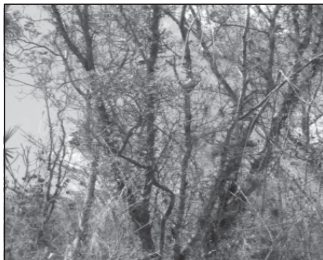
Fig. 3. Acacia daemon "Tres Ceibas de Clavellinas", Corral Nuevo, Matanzas.

Es una especie amenazada, En Peligro (EN) (Berazaín & al. 2005).