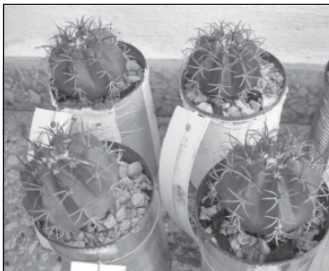
Fig. 2. Melocactus matanzanus , plantas obtenidas de germinadores del año 2005.

Las plantas obtenidas en los germinadores fueron trasplantadas individualmente a bolsas de 12cm de longitud después de alcanzar entre 1-1,5 cm de diámetro. Las plantas alcanzaron, a los tres años después de la germinación, 4,5 cm de diámetro como promedio (Figura 2).