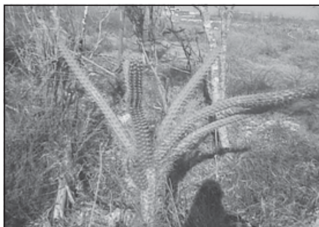
Fig 11. Harrisia eriophora , Punta Guano, costa norte de Matanzas.

En Matanzas la población de la especie Harrisia eriophora ha disminuido en los últimos 10 años, quedando limitada en la costa norte de Matanzas a la zona de Punta Guano, donde se observaron solamente 23 individuos. La especie está sometida a fuertes amenazas por las afectaciones provocadas por la explotación petrolífera en la zona (Enríquez & al. 2005).