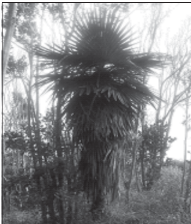
Fig. 4. Coccothrinax borhidiana . Punta Guano, costa norte de Matanzas.

De las cuatro posturas trasplantadas se mantienen dos (50%), con crecimiento de 2 cm en dos años (Tabla III).