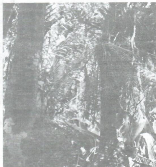
Figura 7: Vista parcial de la Localidad 18 (308/09,211-3/3,4,5) Sierra del Infierno en que aparece un ejemplar de Microcycas calocoma . Nótese el estado de conservación de la vegetación.

parte de una vegetación bastante conservada (Fig. 7) que crece sobre un suelo de carsos esqueléticos poco evolucionados. En el estrato arbóreo se destacan Gaussia princeps , Bursera simaruba y Clusia rosea ; en el estrato arbustivo Thrinax morrisii , Oxandra lanceolata , Bombacopsis cubensis y Plumeria sericifolia ; entre las lianas, Selenicereus grandiflorus y Vanilla sp; y entre las epífitas, Tilandsia sp y Oncidium sp.