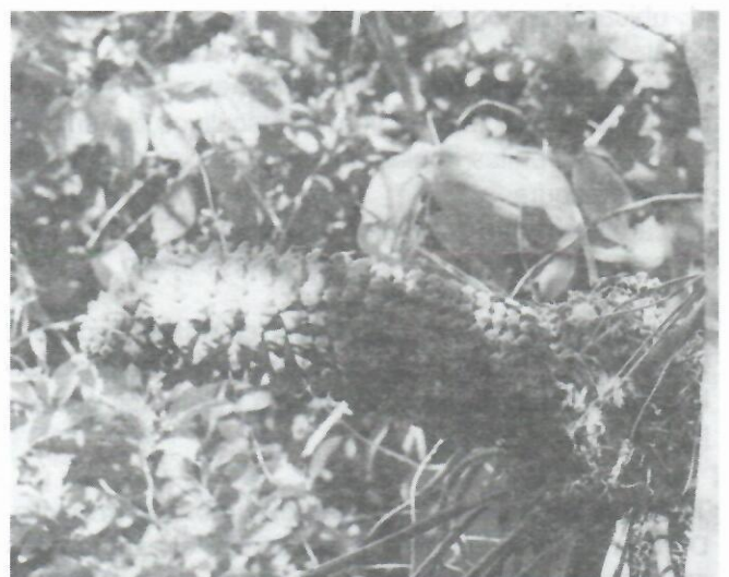
Figura 3: Extremo apical de un ejemplar femenino de Microcycas calocoma con estróbilo totalmente desarrollado de la Localidad 12 (310,241-2,9) Loma Granadinos.

Los 40 ejemplares de Microcycas hallados en esta localidad ocupan un área de 0,016 Km 2 y se distribuyen irregularmente. La altura de las plantas oscila entre 1,0 y 10,5 m; más del 50% de los mismos alcanza entre 4 y 7 m de altura y aproximadamente el 50% de los ejemplares muestra ramificaciones originadas por daños mecánicos a los troncos. Los especímenes son muy viejos en general, lo que se deduce del diámetro de los troncos, algunos de los cuales superan un metro. Un total de 22 ejemplares es fértil (Fig. 3), aunque la estructura poblacional refleja dificultades en la reproducción natural, la existencia de tres especímenes entre uno y dos metros de altura, sin daños y ubicados hacia la base de la elevación indica que posiblemente a finales del siglo pasado hubo alguna producción natural de semillas. En esta zona no se observó actualmente producción natural de semillas ni la presencia de especímenes en estadio juvenil. El estado fitosanitario de las plantas es medianamente bueno, aunque se observa la presencia de líquenes costrosos y fumagina en algunos especímenes.