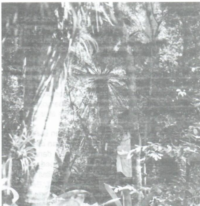
Figura 6: Aspecto general de la vegetación en la Localidad 17 (306/07, 209-1,2,3/6,7) Sierra del Infierno, durante la inventarización de Microcycas . Nótese un ejemplar adulto al centro.

Bursera simaruba y Clusia rosea ; en el estrato arbustivo Thrinax morrisii , Oxandra lanceolata , Bombacopsis cubensis y Plumeria sericifolia ; entre las lianas, Selenicereus grandiflorus y Vanilla sp y las epífitas Tilandsia sp y Oncidium sp.