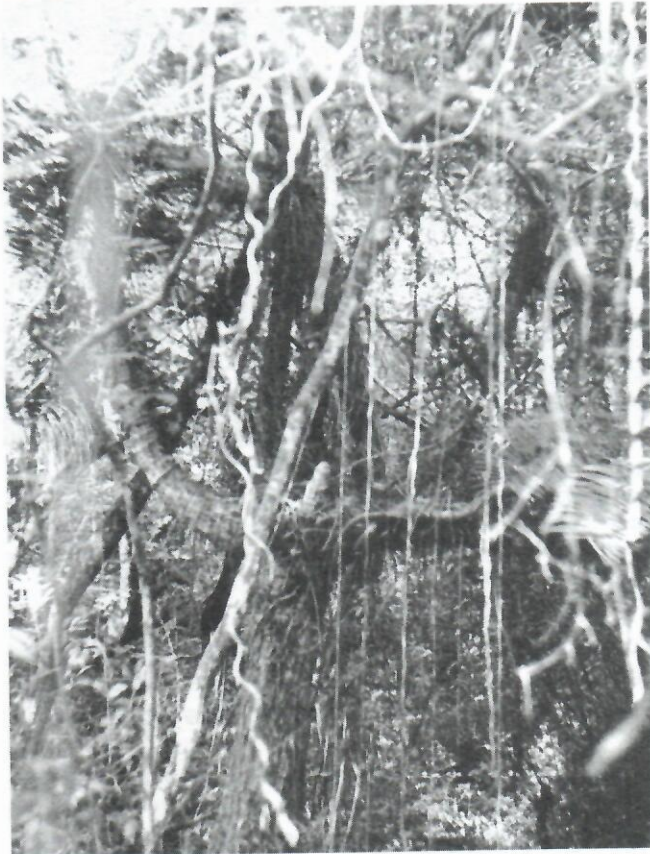
Figura 4: Aspecto de la Localidad 13 (306,242-2,9) Managuaca. Se destaca el tronco de un espécimen viejo en el cual se han producido varias ramificaciones como respuesta a daños mecánicos.

Esta localidad se encuentra entre 40 y 50 m.s.n.m. y constituye prácticamente una franja de no más de tres metros de ancho que está limitada por la margen oeste de un arroyo; presenta suelos fértiles, pardos sin carbonatos y bien irrigados. Microcycas forma parte de un bosque de galería de origen secundario (Fig. 4) donde domina el estrato arbóreo, de altura moderada, con especies como Clusia minor , Pitecellobium sp., Dichrostachys cinerea y Roystonea regia . En la vegetación se destacan también trepadoras como Selenicereus sp, Vanilla sp y Bahuinia cumanensis .