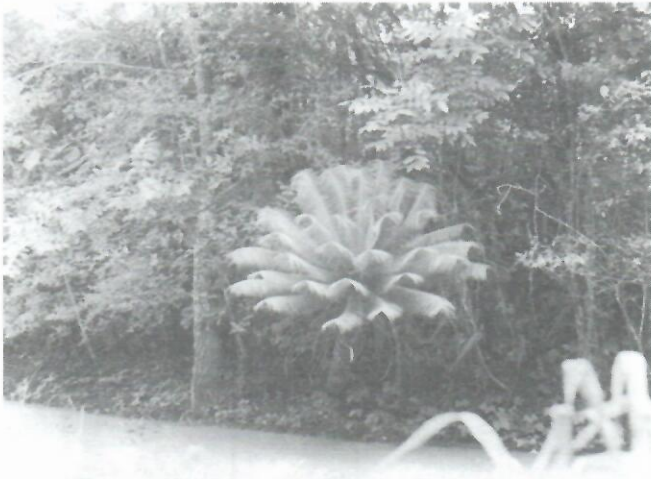
Figura 8: Vista de la Localidad 19 (297,232-5) Cinco Palmas en la que sobresale un ejemplar de Microcycas calocoma . Nótese la proximidad de las plantas al agua.

pequeña corriente de agua que crece en época de lluvia (Fig. 8). Microcycas se encuentra formando parte de un matorral de origen secundario donde se destacan Dichrostachys cinerea y Bahuinia cumanensis . La cícada sobresale en la vegetación y la base de algunos troncos queda sumergida durante la época de lluvia. Esta zona se caracteriza por presentar suelos pardos sin carbonatos y fértiles.