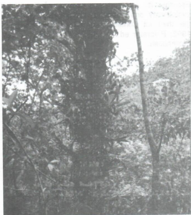
Figura 10: Aspecto del tronco de un ejemplar de Microcycas calocoma en la localidad cercana al Arroyo del Desmayo. Nótese la gran cantidad de epífitos y lianas que lo cubren totalmente.

De otra parte, hay indicaciones de que en la elevación conocida como Loma de la Planta Eléctrica, también