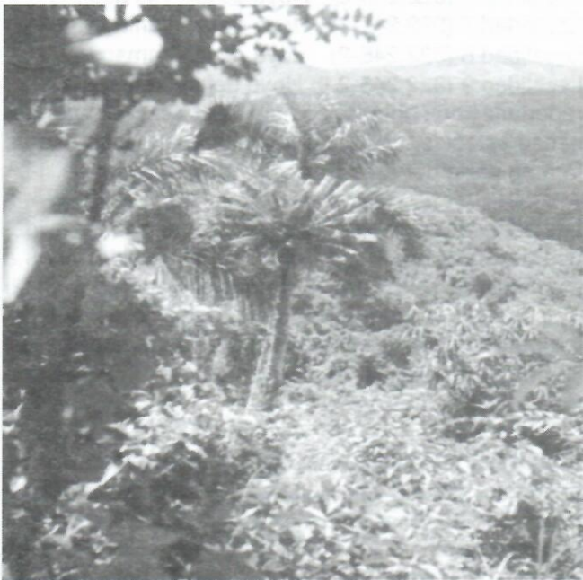
Figura 2: Vista de la Localidad 11 (314,222-8,9) Loma Maceo donde se observa el ejemplar más próximo al acceso.

En esta localidad (Fig. 2) Microcycas forma parte de un pinar sembrado por el hombre donde ha crecido un matorral de origen secundario. Los 22 especímenes adultos encontrados están dispersos, ocupando un área de 0,01 Km 2 . De éstos, siete son fértiles y la altura de las plantas oscila entre 0,2 y 9 m.