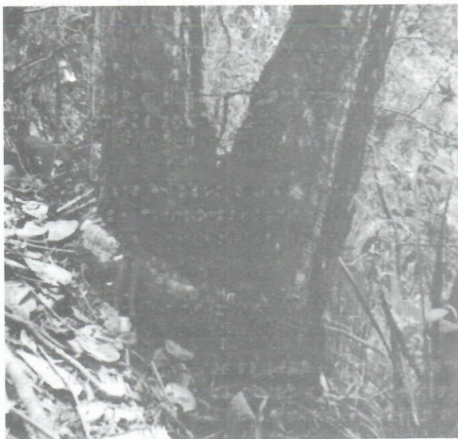
Figura 9: Vista parcial de un ejemplar de Microcycas calocoma talado a nivel del suelo en la localidad cercana al Arroyo del Desmayo y su potencialidad para rebrotar.

El tronco de los especímenes no se deja ver por la gran cantidad de bromeliáceas, aráceas, musgos y líquenes en varios ejemplares (Fig. 10).