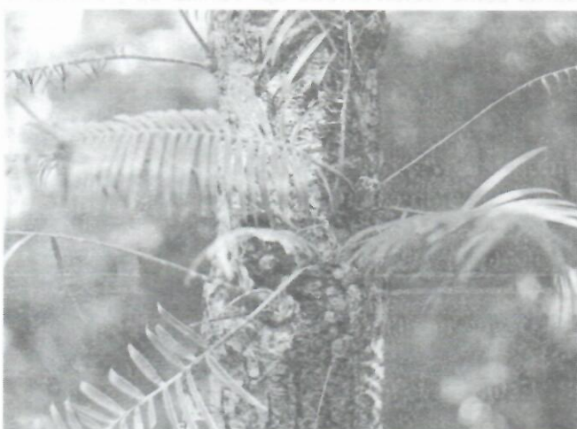
Figura 5: Respuesta a daños mecánicos en especímenes de la Localidad 16 (302, 221-1,7,8) Km 14,5 PR-Viñales. A, desarrollo de raíces adventicias en el tronco de un ejemplar femenino dañado; B, diferenciación de numerosos brotes en zonas dañadas del tronco de un ejemplar talado a 1,5 m de altura.

Los trabajos de prospección realizados con anterioridad permitieron orientar los estudios de investigación de este valioso fitorrecurso y hallar tres nuevas localidades.