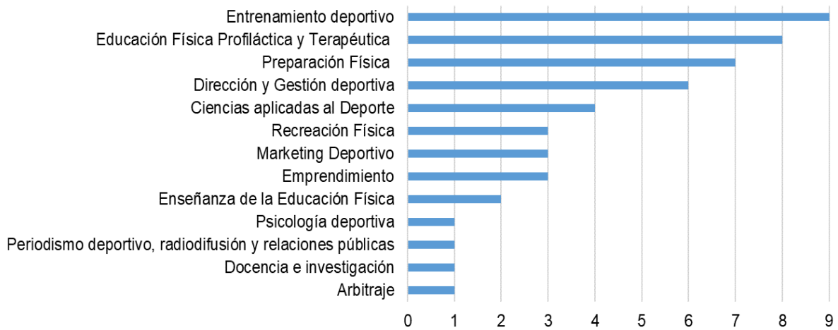
Figura 2. Gráfico de tendencia de los campos ocupacionales de los perfiles profesionales en los países del grupo 2.

De acuerdo a los resultados obtenidos se observa lo siguiente: