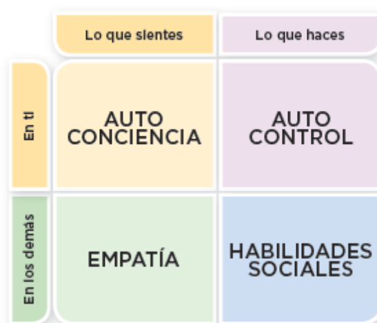
Figura 1. Función de Gestión Emocional.

Tal vez la comprensión del tema sea más fácil si se analiza un esquema acerca de cómo funciona la gestión emocional (Figura 1).