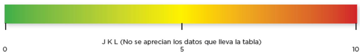
Figura 4. Escala de valoración.