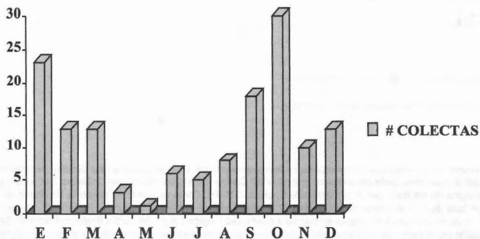
Fig. 1. Comportamiento de las colectas por meses.