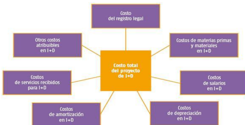
Figura 2. Acumulación de costos que conforman el total del fomento del activo fijo intangible.