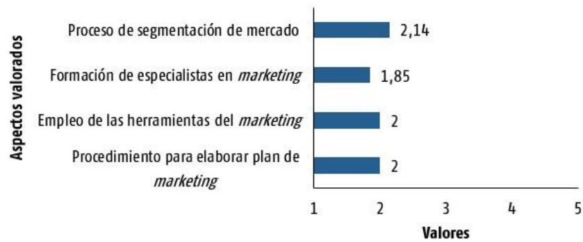
Figura 3. Valoración de los expertos en función de la segmentación de mercado.