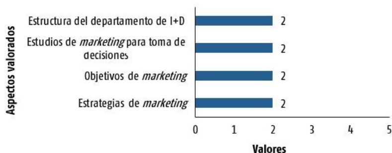
Figura 1. Valoración de los expertos en función de las estrategias de marketing .

La empresa no tiene trazadas estrategias de marketing y sus objetivos no están adecuadamente elaborados. Los estudios al respecto son poco utilizados por los directivos para la toma de decisiones y no existe un departamento de investigación y desarrollo debidamente estructurado (Figura 1). Los expertos otorgaron 2 puntos (nunca) a la valoración de estos aspectos.