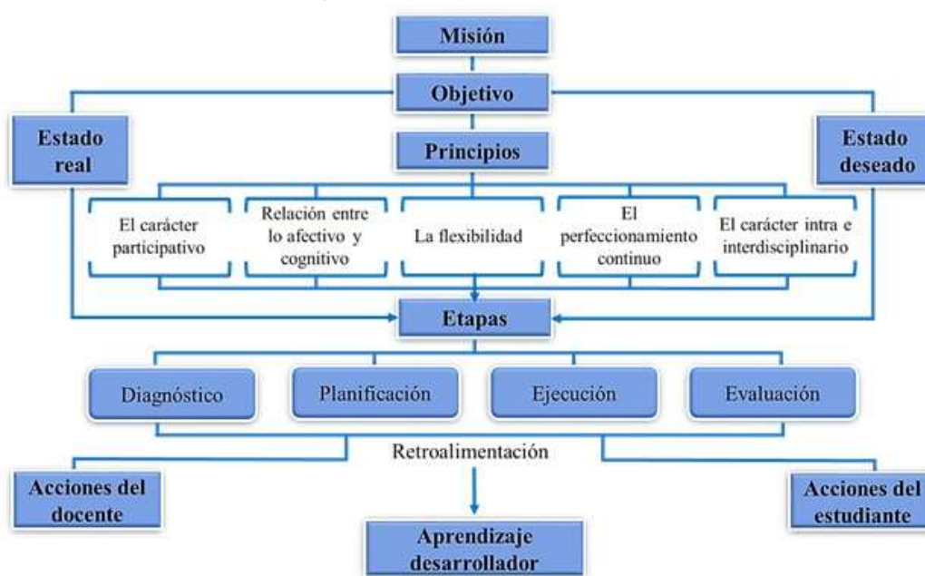
Figura 1. Estructura de la estrategia didáctica propuesta.

reflexionar sobre los enfoques teóricos y didácticos, integrar la información procesada y obtener como producto una estrategia didáctica para el proceso de enseñanza-aprendizaje de la integral definida. Su estructura se presenta en la figura 1, que utilizó de forma planificada y consciente el asistente matemático Mathcad como medio de enseñanza-aprendizaje.