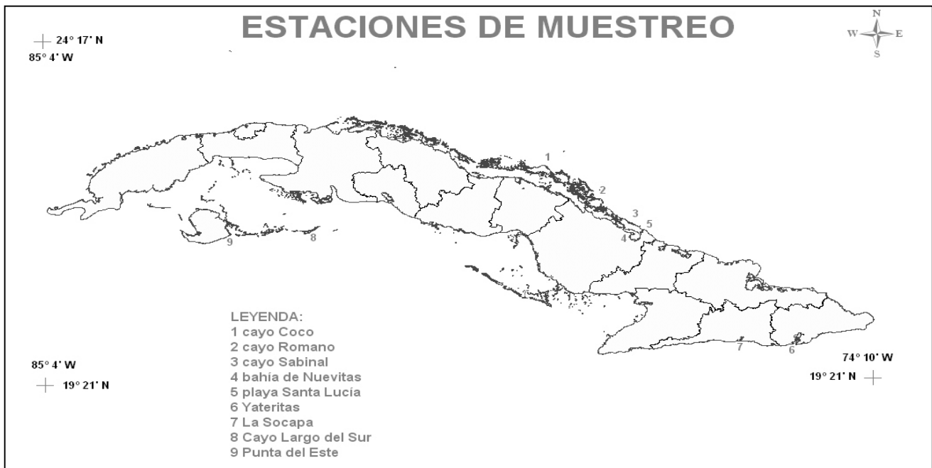
Fig. 1. Estaciones de muestreo donde se evaluó la biomasa de arribazón de Sargassum .