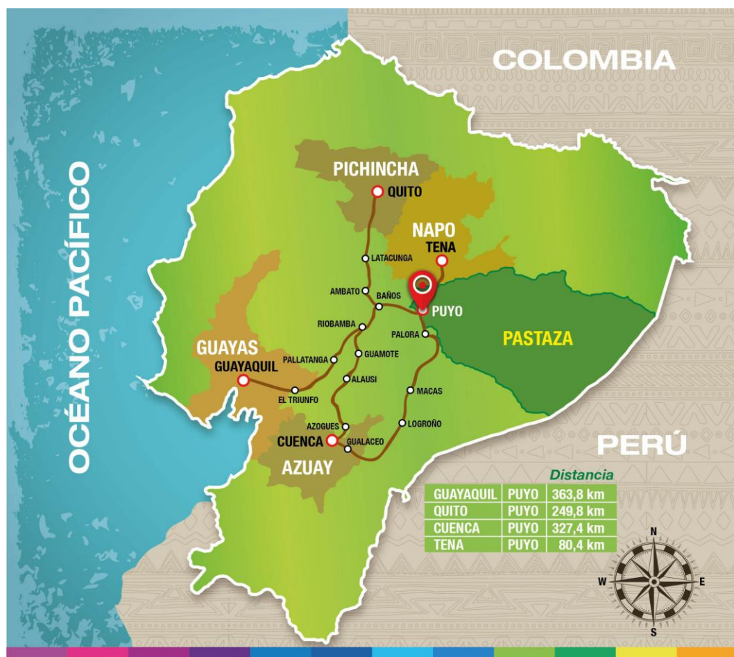
Figura 1. Ubicación de Pastaza dentro de Ecuador.

En Pastaza, esto se refleja en iniciativas de turismo comunitario y ecoturismo que involucran directamente a las poblaciones locales para la sostenibilidad. La sostenibilidad en el turismo implica, equilibrar el crecimiento económico con la protección ambiental y la equidad social.