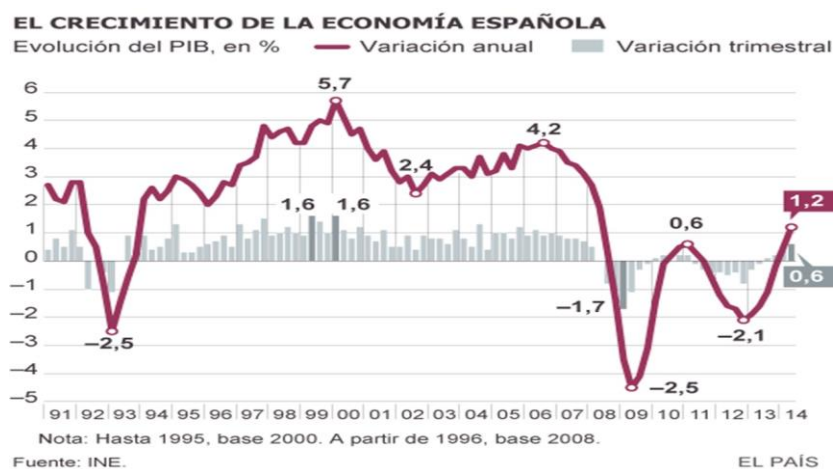
Figura 1. Crecimiento de la economía española.

Al igual que otras economías nacionales, desde los años 90 del pasado siglo la evolución del crecimiento del PIB de la economía española –lo que los economistas llamamos el ciclo - muestra la forma de un serrucho, con altas y bajas precedidas y seguidas de caídas más profundas en 2009 y 2012 (figura 1). Para algunos analistas en 2009 “la peor crisis de la historia reciente de la economía española”.