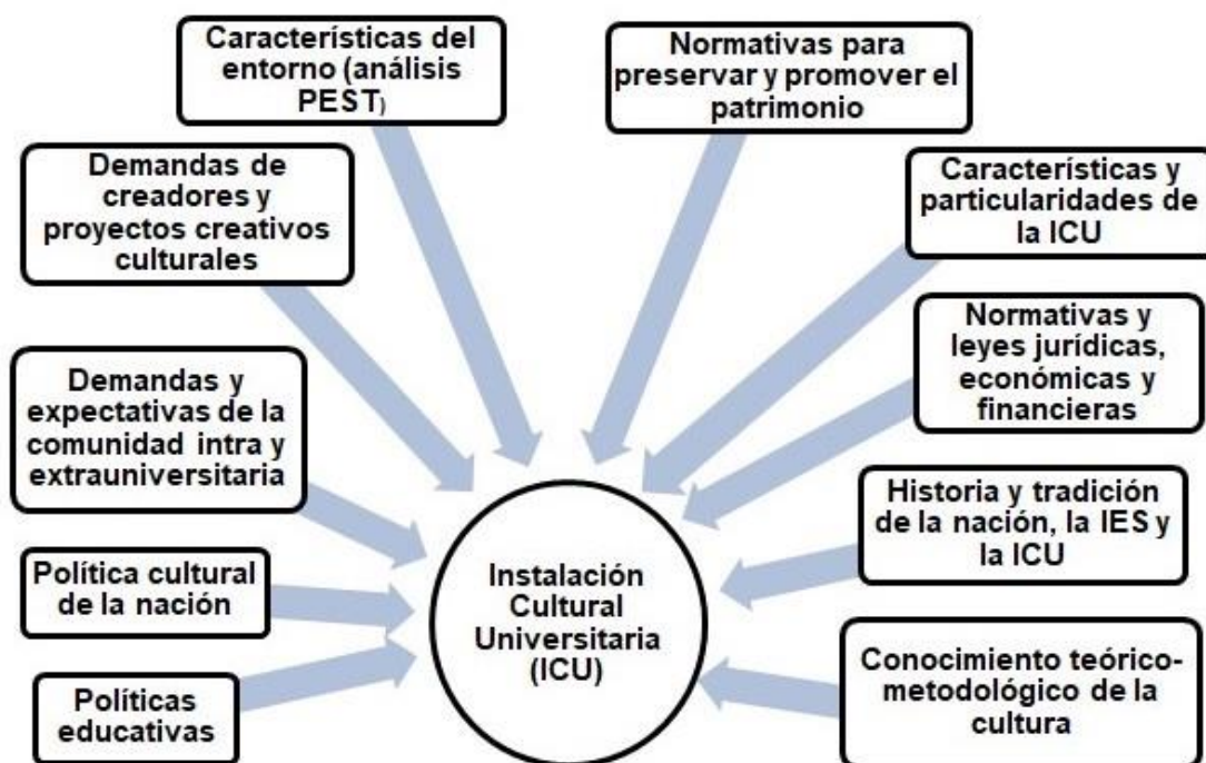
Figura 2. Factores que influyen en la gestión de una instalación cultural universitaria.

entre sus principios esenciales, desarrollar el proceso educativo vinculado a lo social y humano, cercano a las personas, de ahí la importancia de utilizar la información que ofrece la realidad social actualizada de la región, de la comunidad, de la familia, como fuentes en la que cada cual vea mejor reveladas las generalizaciones y leyes sociales. (Rodríguez y Rey, 2017, p. 13)