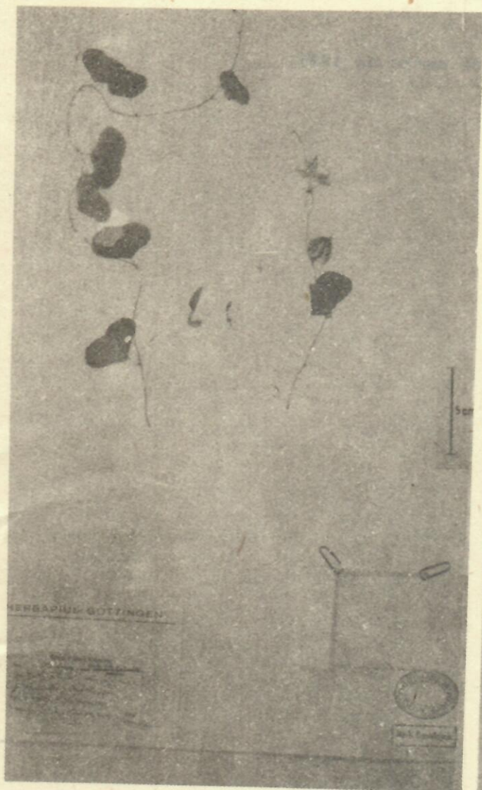
Figura 1. Foto del Holotipo (Wright s.n., GOET) de Aristolochia baracoensis Rankin.