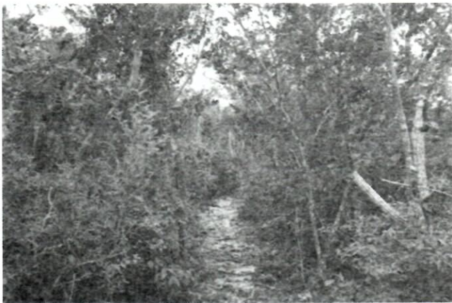
Fig. 4. Aspecto general de la vegetación en la Localidad 10, en el sendero ecológico La Laguna donde habita uno de los grupos de Z. integrifolia .

su presencia en la franja de costa arenosa, entre los 0-5 m s.n.m. La vegetación actual se caracteriza por la dominancia de la especie Casuarina equisetifolia y la presencia de algunos elementos del complejo de vegetación de costa arenosa (Fig. 5).