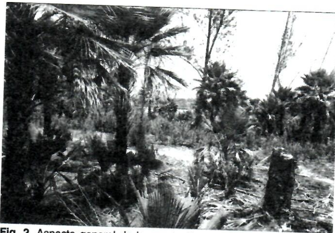
Fig. 2. Aspecto general de la vegetación en la Localidad 2, donde habita Z. pygmaea .

de la base de campismo Dos Hermanas, a 2 Km del pueblo de Viñales, Municipio Viñales, Provincia Pinar del Río. Las plantas de Zamia amblyphyllidia se ubican entre los 170-250 m s.n.m. En el área se localizaron 11 especímenes en los que se observaron estructuras reproductoras de ambos sexos, y una postura de menos de dos años, dispersas en un área de 0,0018 Km 2 . El suelo en la zona es pardo con carbonatos sobre piedra hueca. La vegetación se encuentra poco alterada y con los elementos típicos del complejo de vegetación de mogotes.