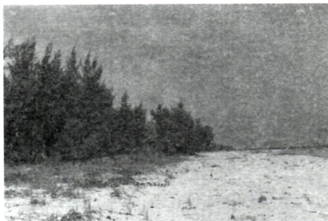
Fig. 5. Aspecto general de la vegetación en la Localidad 11, para la que se había reportado la presencia de Z. integrifolia

El estudio realizado reporta beneficios innegables para poder acometer la conservación de Zamia en Cuba occidental. Cada una de las localidades cuenta con un nombre, ubicación y la especie de Zamia presente, lo cual que permite el fácil acceso a las mismas y la ejecución de estudios de monitoreo. El tratamiento